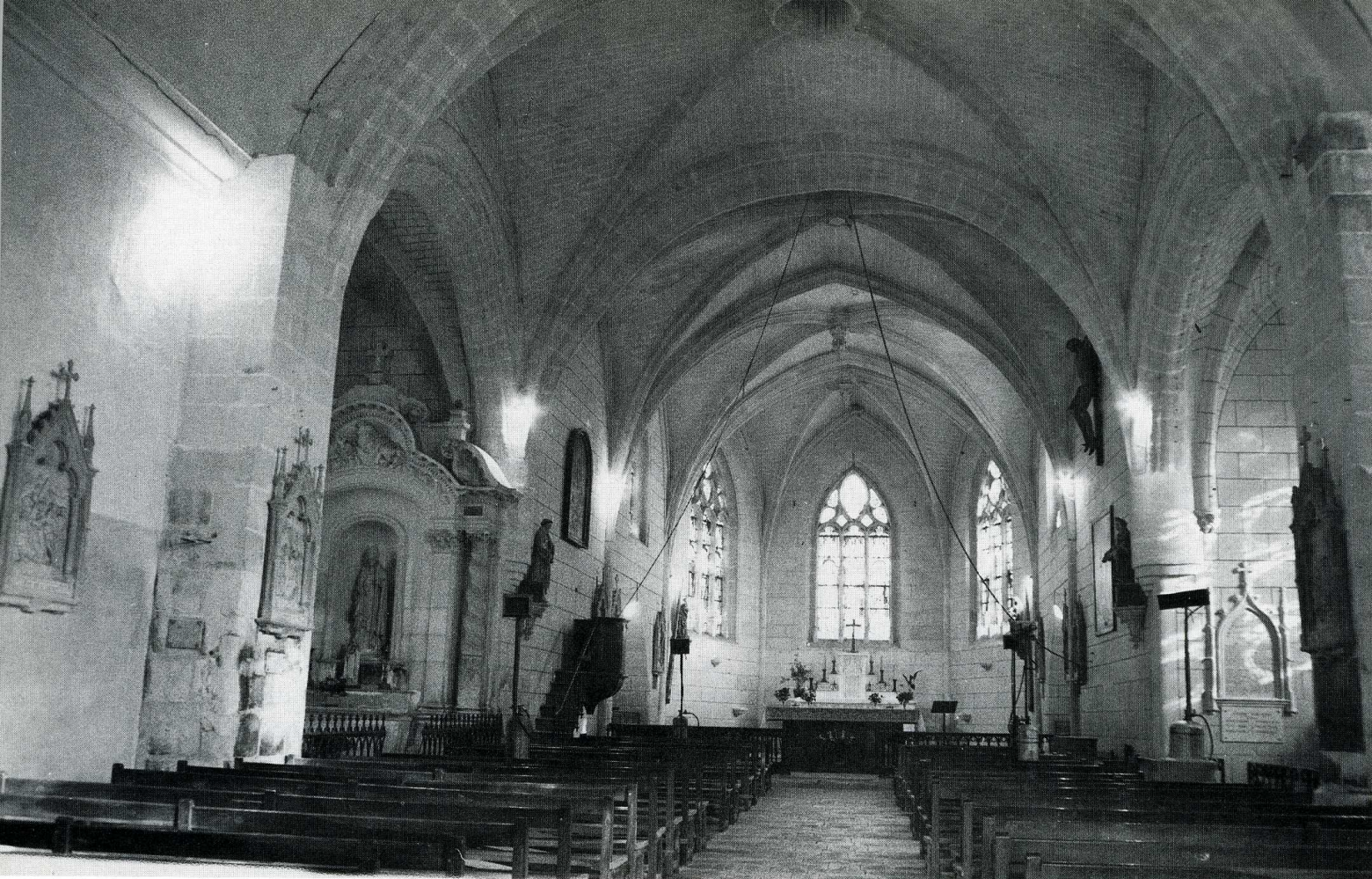
Chissay-en Touraine (Loir-et-Cher).