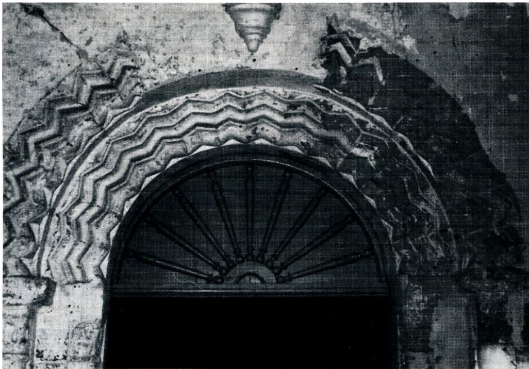
Le Charmel (Aisne).