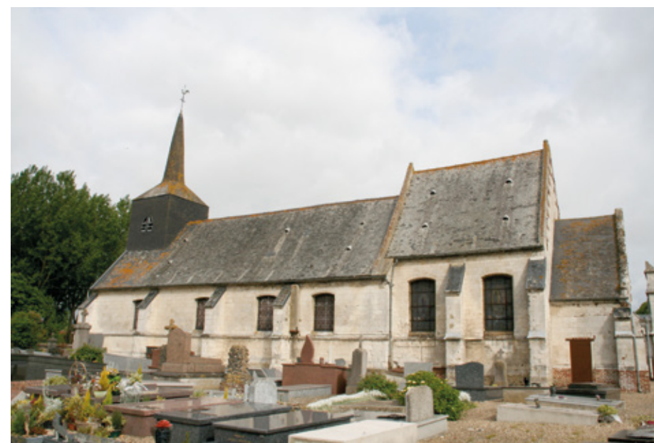
3. Vue générale sud