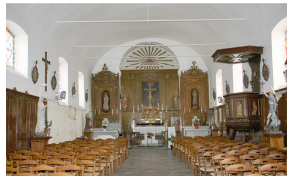
6. Vue intérieure vers le chœur

É GLISE SAINT-MARTIN. Saccagé et incendié par les troupes lors du siège de Thérouanne, en 1553, le village a été reconstruit sur le plateau, autour d'un vaste espace quadrangulaire, dénommé le Rietz. Élevée sur le côté de cette place enherbée, près d'une chapelle funéraire du XIX e siècle, l'église Saint-Martin est un édifice modeste, construit dans la pierre crayeuse du pays, consistant en une nef couverte d'un comble à deux versants, prolongée par un chœur plus étroit, mais doté d'un comble plus élevé, et par une petite sacristie. Les soubassements sont en brique, de même que les épis qui renforcent les pignons des murs.