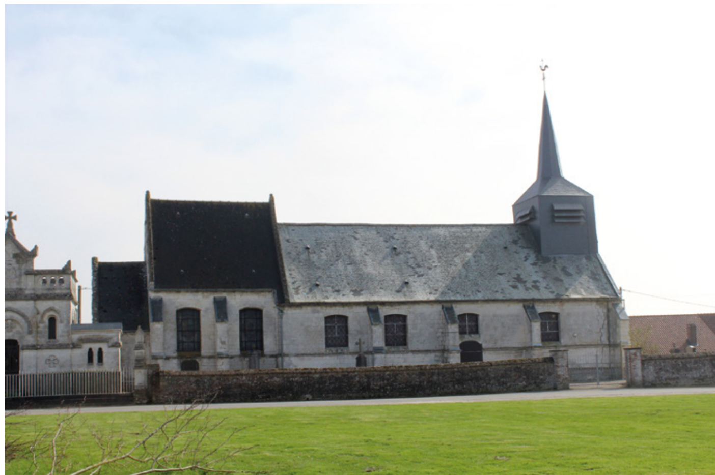
1. Façade nord

Commune nouvelle Saint-Augustin, canton Fruges, arrondissement Saint-Omer, 306 habitants