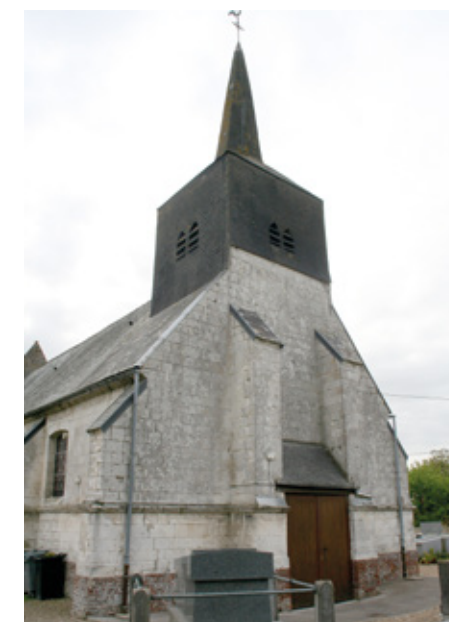
4. Vue générale ouest