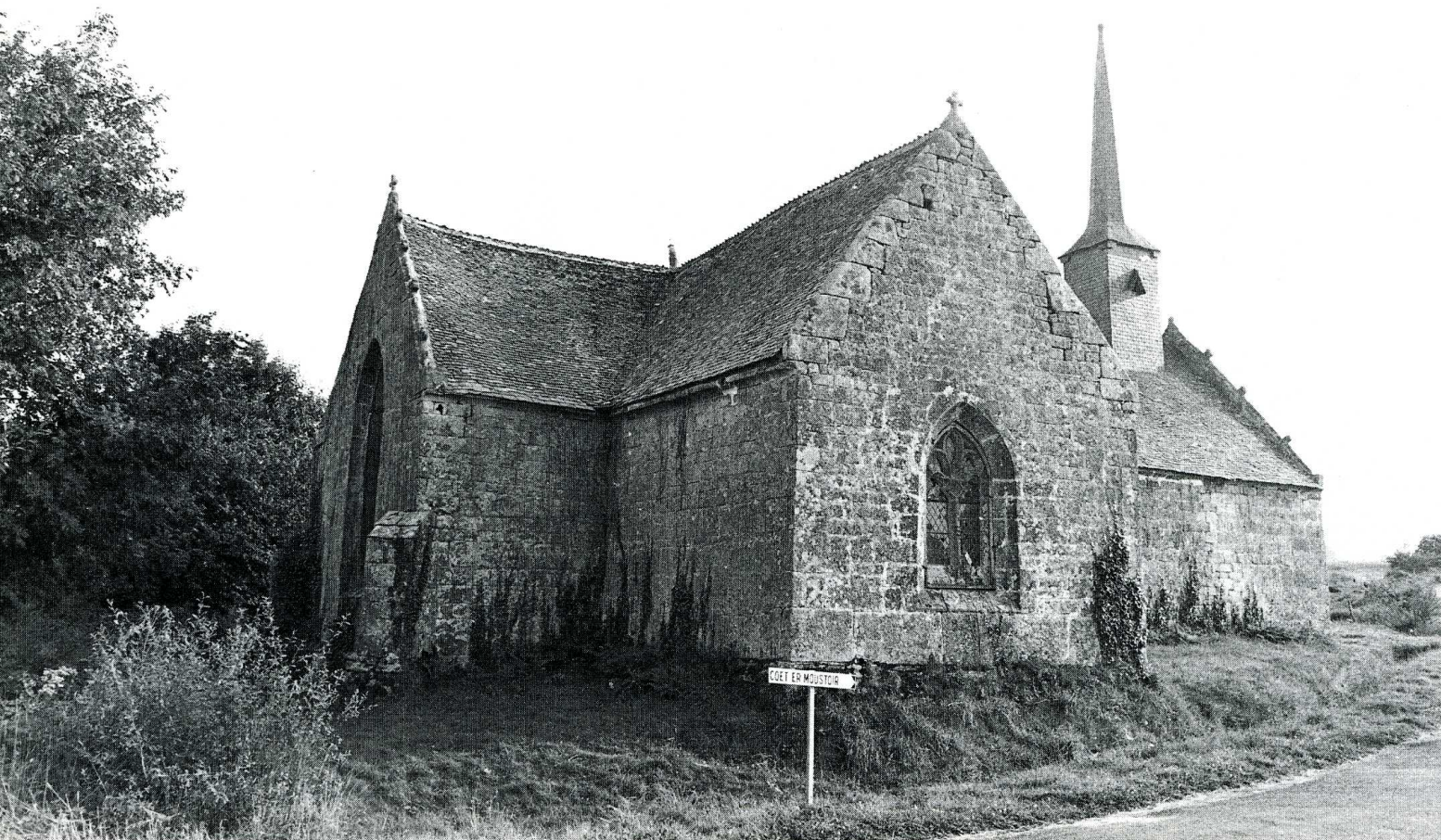
Cléguerec (Morbihan). Chapelle Saint-Jean-Baptiste, chevet et transept.