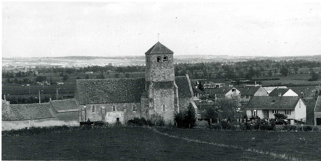
Colombiers (Cher), église Saint-Martin. Vue d'ensemble du côté sud.

Cher, canton et arrond. de Saint-Amand-Montrond, 320 hab.