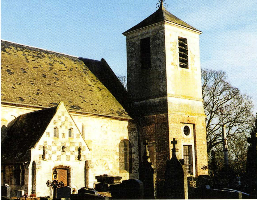
Condé-sur-Risle (Eure) Église Saint-Martin 1. Façade sud et porche 2. Poutre de gloire 3. Saint Martin

bardeau ; l'arc triomphal qui les sépare est orné d'une poutre de gloire. Les anciennes ouvertures romanes en haut des parois de la nef ont été murées et remplacées à la fin du XVIII e s. par de larges baies dont les ébrasements sont en briques. Le pignon du porche est constitué d'un élégant appareil de silex noir et de pierres de taille blanches en damier. Il est décoré de deux petites statues de pierre, situées de part et d'autre de la porte d'entrée. Parmi l'abondant mobilier ancien, il convient de citer, outre la chaire à prêcher et les autels du XVIII e s., une statue équestre de saint Martin en bois polychrome du XVI e siècle.