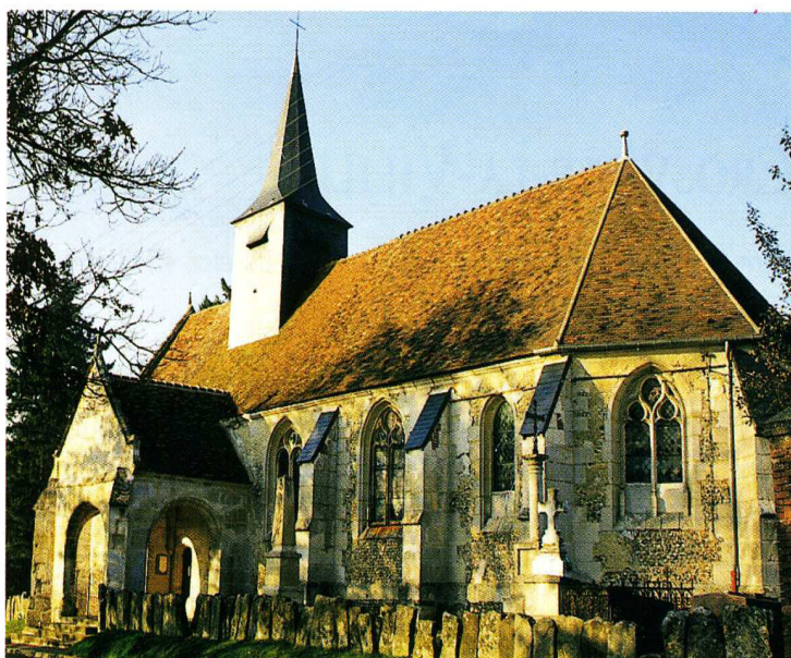
Corbeil-Cerf (Oise) Église Sainte-Honorine 2. Vue du sud-est 3. Vue intérieure vers l'abside

L'ensemble n'a pas été commencé avant l'extrême fin du Moyen Âge et la construction a pu se poursuivre assez avant dans le XVI e s., si ce n'est jusqu'au XVII e s., comme en témoigne la juxtaposition de remplages encore flamboyants et d'autres déjà d'esprit classique dont les piédroits des baies sont pareillement traités en gorges largement ouvertes.