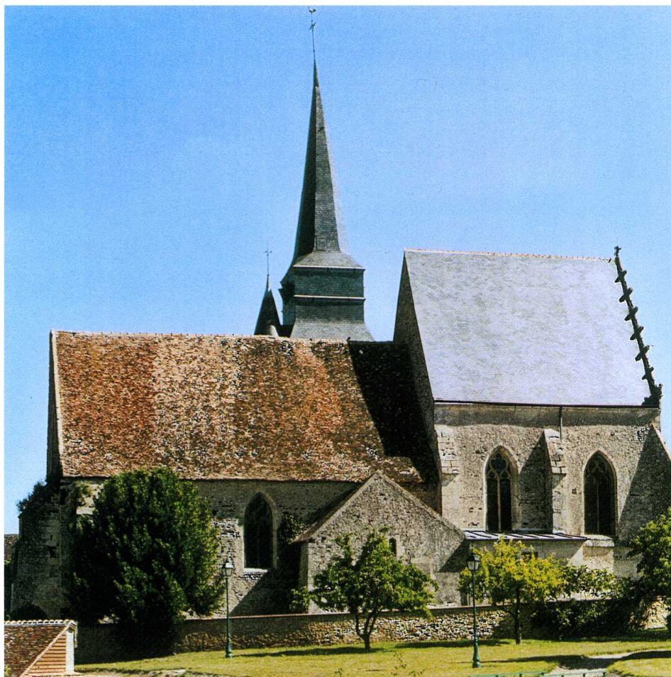
Cormes (Sarthe) Église Saint-Denis 1. Façade sud (cl. A. Barbier, arch., 2004)

Parmi les objets mobiliers conservés dans l'édifice, on note une Vierge à l'Enfant en pierre, qui date du XV e s., un saint Sébastien en terre cuite identifié par le conservateur des Objets d'art du département, signataire de cet article, comme une œuvre du XVI e s. et non du XIX e s., contrairement à ce que certains croyaient auparavant. Un saint Denis en pierre, statue reliquaire du XV e s. a connu de nombreux avatars, le dernier étant certainement une malencontreuse restauration.