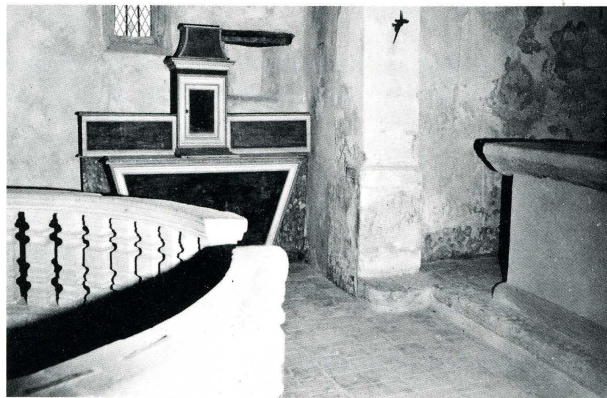
Les Côtes d'Arej (Isère). Église Saint-Mamert. En haut : le mur de l'enclos (X e -XI e s.). En bas : autel roman et balustrade.

Oyand », conduisant depuis la vallée du Rhône jusqu'à Saint-Claude, l'ancien Condat . En 956, un certain Aganon et sa femme Richilde firent donation à l'abbaye de Cluny de ce qu'ils possédaient à Saint-Mamert. En 998, Cluny acquiert le droit de patronage sur l'église de Saint-Mamert. Les moines bénédictins de Cluny y établirent un petit prieuré, une cella qui figure parmi les possessions de Cluny confirmées par le Pape en 1055. L'église actuelle, avec sa nef anciennement couverte de charpente, son abside voûtée en cul de four et son clocher-mur placé au-dessus de l'entrée n'est peut-être pas antérieure au début du XII e s.