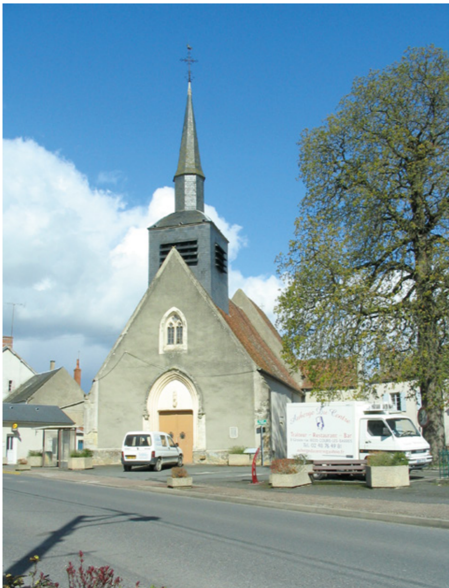
1. Façade ouest

É GLISE SAINT-PANTALÉON. Située à la limite est du département du Cher, en bord de Loire, la commune de Cours-les-Barres est reliée à la Bourgogne voisine par le pont de Fourchambault-Givry. Cette ancienne paroisse portait le nom de Cours-sur-Loire jusqu'au XIV e siècle, et encore Cours-les-Barres-sur-Loire en 1804. Elle dépendit de l'évêché de Nevers du IX e siècle jusqu'au concordat (1801). Son histoire est liée aux seigneurs de Givry et des Barres qui ont le titre de barons. La construction de l'église de Cours-les-Barres, sous le vocable de Saint-Pantaléon, remonte au XIV e siècle (structure de la nef, fenêtre du pignon occidental et baie de la façade sud de la nef), au moment où la famille des Barres s'établit durablement dans la région. Le patronage de saint Pantaléon, médecin martyr du IV e siècle, correspond au culte des saints thaumaturges invoqués lors des épidémies de peste du XIV e siècle. Au XV e siècle, après la guerre de Cent Ans qui a fait des ravages dans cette région entre Berry et Bourgogne, l'église est remaniée (voûte d'ogives des deux premières travées du chœur, porte occidentale).