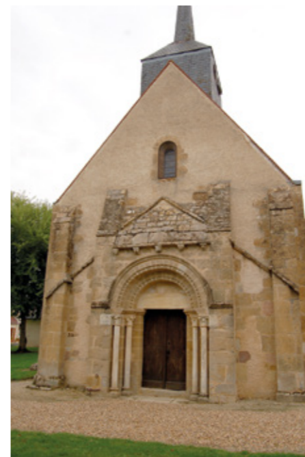
1. Façade ouest