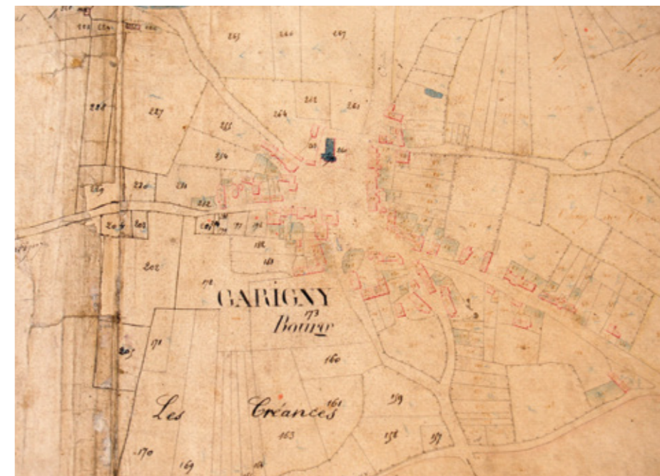
2. Plan cadastral