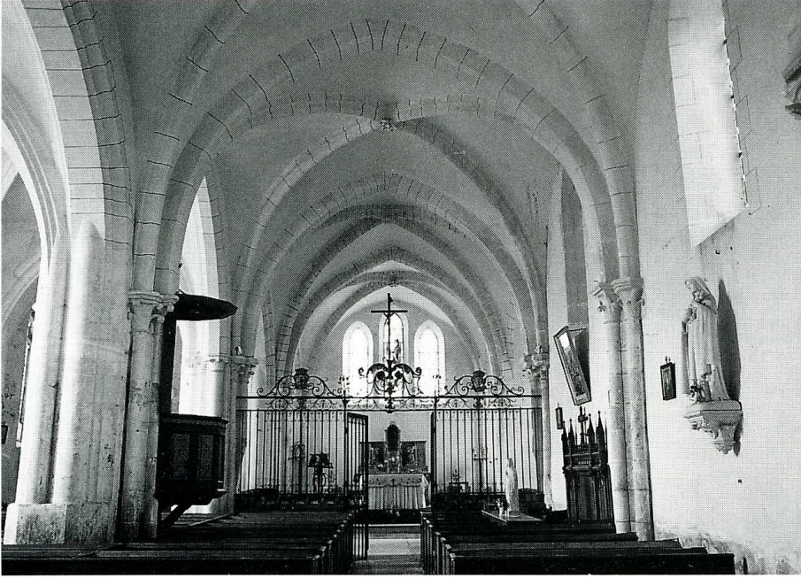
Courgis (Yonne). Église Notre-Dame, nef en direction du chœur, grille en fer forgé du XVIII e siècle.