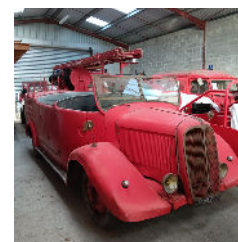
Gujan-Maestras (33) camion de pompiers, en restauration