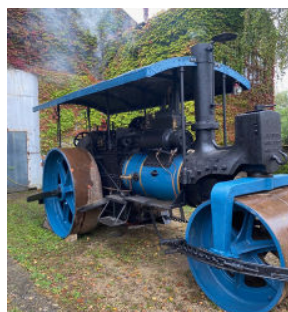
Montceau-les-mines (71) Cylindre Alliot avant/après restauration