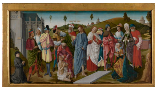
Usson (56) Retable La Résurrection de Lazare avant/après restauration