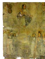
Saint-Laurent-sur-Oust (56) Donation du rosaire avant/après restauration ©J. Verdavaine