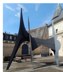
Bourges (18) Caliban par Alexandre Calder choisi par les salariés de St-Doulchard avant restauration