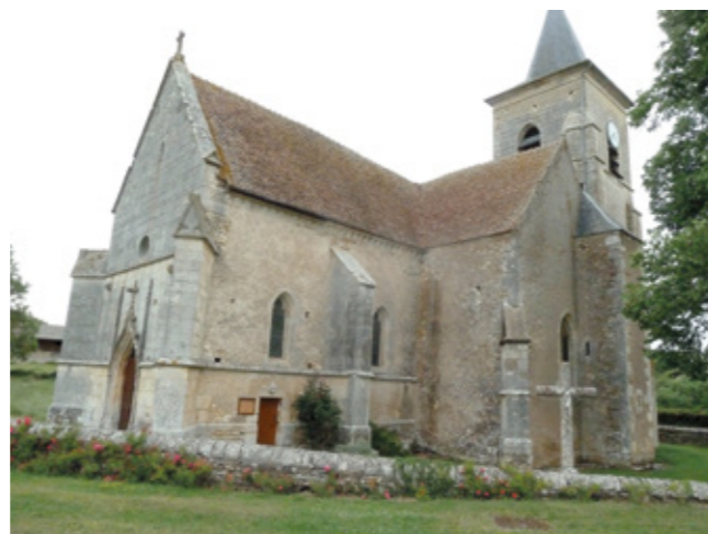
3. Vue sud-ouest