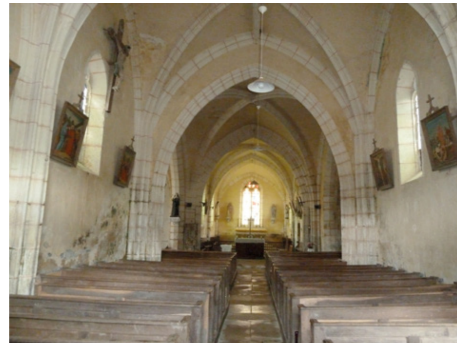
5. Vue intérieure

Parmi le mobilier protégé au titre des monuments historiques, signalons deux tableaux : La Montée au Calvaire (XVII e siècle), composition inspirée d'un détail d'une Crucifixion due à Bernardino Luini (1529) et Saint Jean-Baptiste (XVIII e siècle) ; un Christ en croix (XVII e siècle) ; une verrière : La Vie de saint Martin (milieu du XVI e siècle) et une clochette à main dite de Saint-Pèlerin (XVII e siècle).