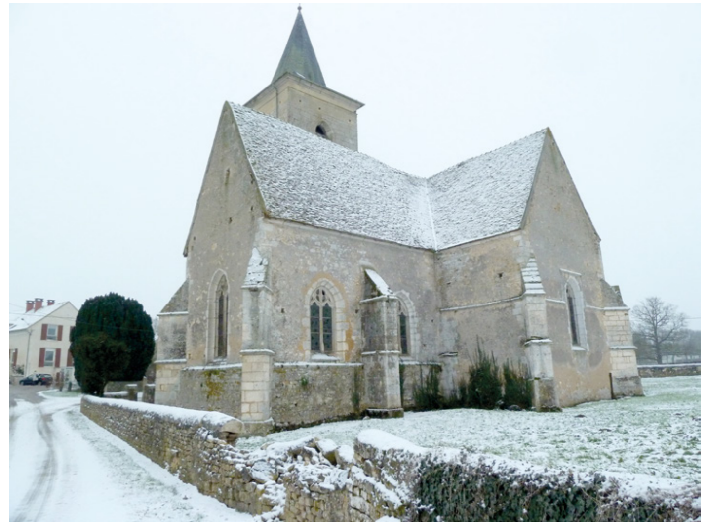
4. Vue nord-est