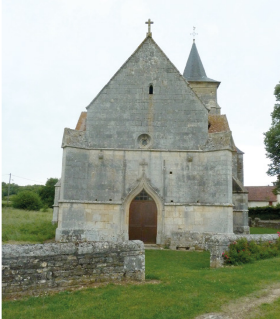
1. Façade occidentale

L'ÉGLISE SAINT-MARTIN, orientée, est bâtie à l'entrée du village, sur un plan en croix latine composé d'une nef de deux travées, d'un transept et d'un chœur de deux travées. L'ensemble, d'une grande unité architecturale, fut édifié au premier quart du XVI e siècle en moellons de pierre appareillés. L'intérieur est voûté sur croisée d'ogives, celles de la nef étant à liernes et tiercerons, dont les nervures à moulures prismatiques retombent sur des colonnes engagées sans chapiteaux. La porte d'entrée principale, aux piédroits prolongés par des pinacles, est couverte par un arc brisé amorti par une croix dont les rampants sont ornés de choux frisés ; elle ouvre dans une façade à pignon découvert surmonté par une croix. Les baies, en arcs brisés, sont à remplages flamboyants du côté du chœur. Les murs, en moellons de calcaire, sont limités par un larmier et épaulés par des contreforts à ressauts, talutés ou sur l'angle. La tour de clocher est élevée dans l'angle du chœur et du bras de transept sud, sur le pignon duquel est flanquée une tourelle d'escalier en vis de plan carré, donnant accès aux combles et au beffroi. Cette tour, à deux niveaux, celui du beffroi étant percé d'une baie en arc brisé sur chaque face, a reçu une flèche à égout retroussé. La toiture est à deux pans en tuile plate, bordés par une corniche moulurée, à modillons concaves du côté de la nef.