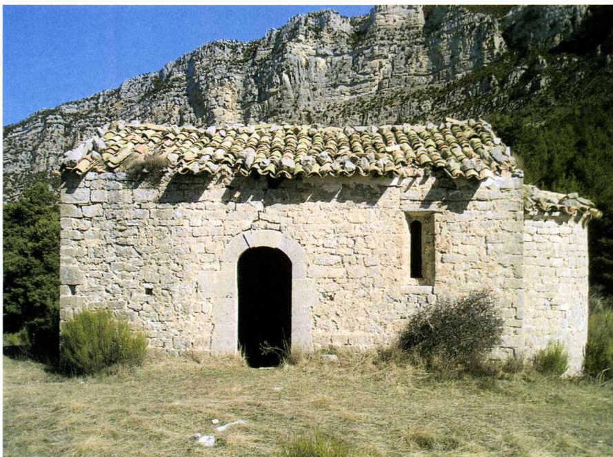
Demandolx (Alpes-de-Haute-Provence) Chapelle Notre-Dame de Conches