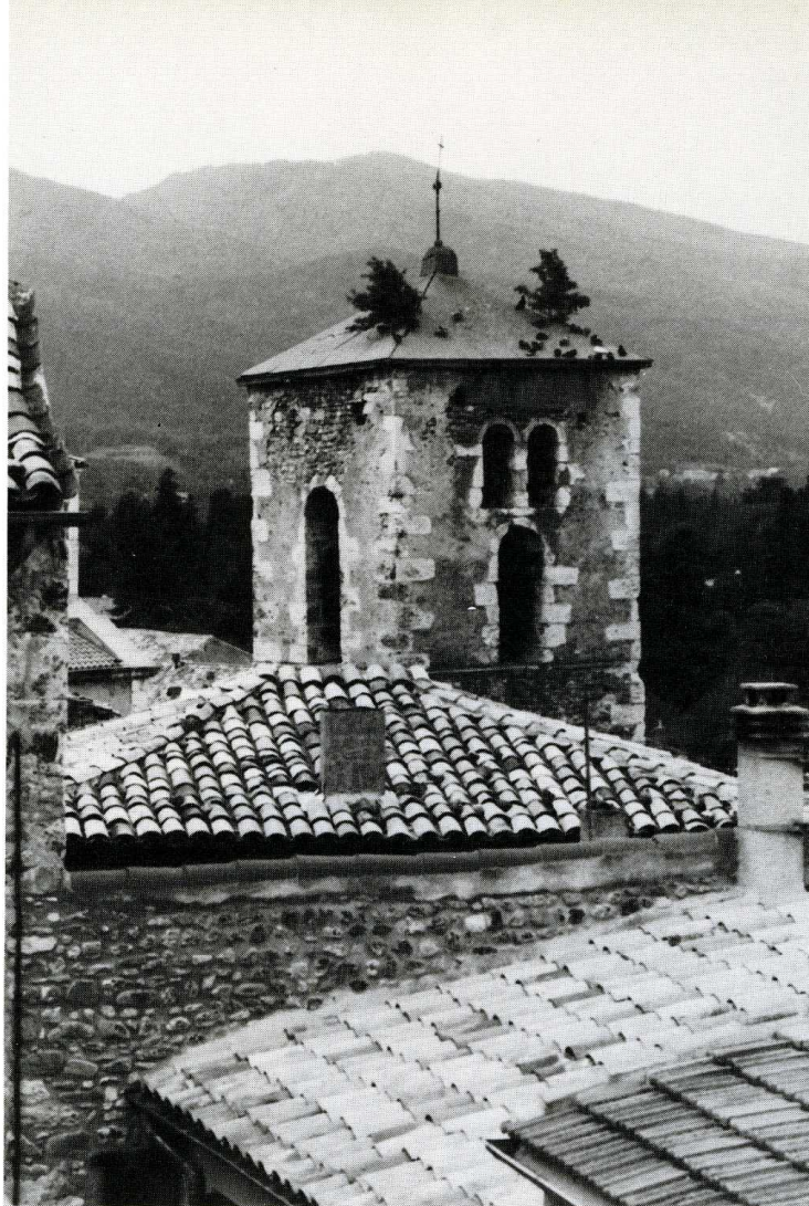
Dieulefit (Drôme). Église Saint-Pierre à La Viale.