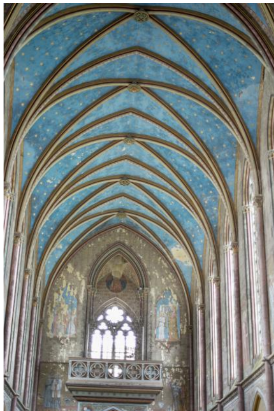
Les fresques de la voûte sur le modèle de Saint-Germain des Prés.