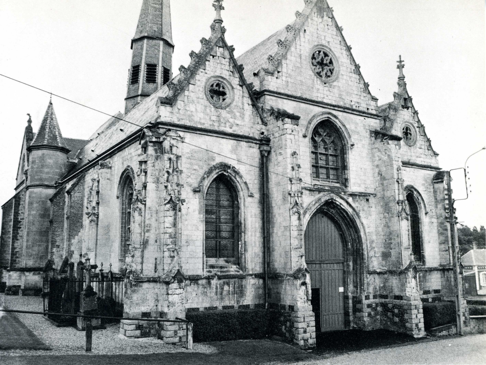
Douriez (Pas-de-Calais). Église de la Nativité de Notre-Dame.