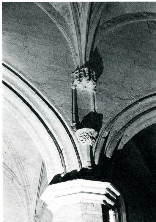
Douriez (Pas-de-Calais). Église de la Nativité de Notre-Dame. Détail.