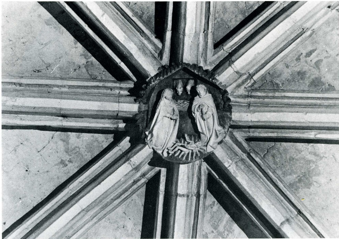
Douriez (Pas-de-Calais). Église de la Nativité de Notre-Dame. Détails.