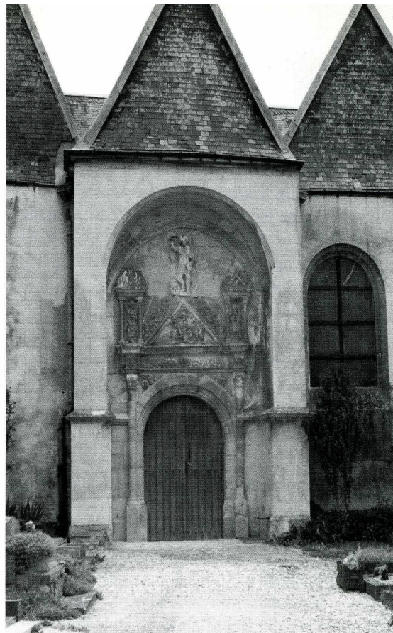
Doux (Ardennes). Église Saint-Martin.