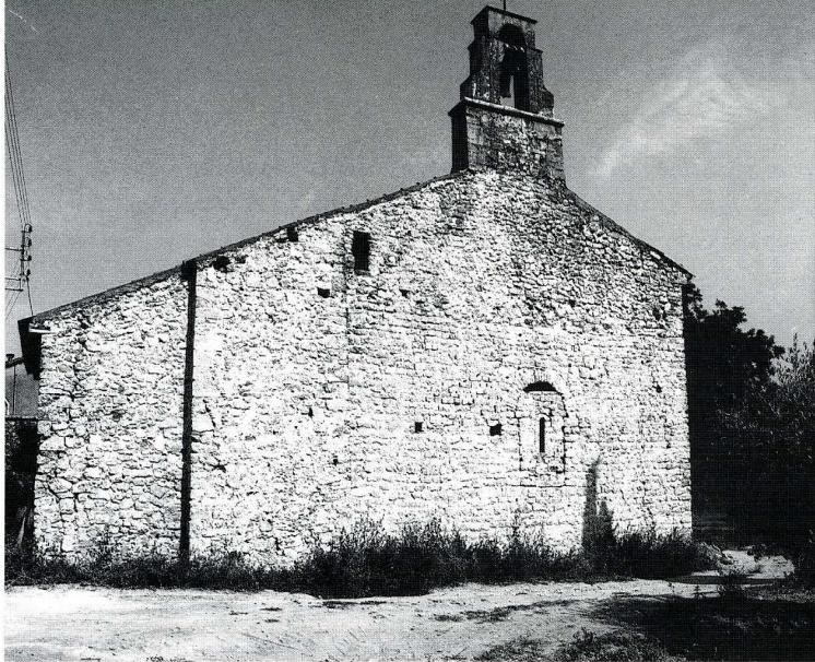
Draguignan (Var). Chapelle Saint-Hermentaire, chevet.

C ETTE chapelle s'élève sur un monticule qui domine la Nartuby à environ 1,5 km au sud-ouest du centre ancien de Draguignan. Des sondages opérés par l'abbé R. Boyer en 1949-1951 ont prouvé que le site était occupé à l'époque antique (partie des thermes d'une villa ). Le culte semble y avoir été installé par des moines venus de Lérins si l'on se fie à son vocable. Hermentaire, évangelisateur légendaire de Draguignan, aurait été moine à Lérins. Le prieuré passa sous l'obédience de l'abbaye niçoise de Saint-Pons en 1235 et le demeura jusqu'à la Révolution. Les bâtiments conventuels