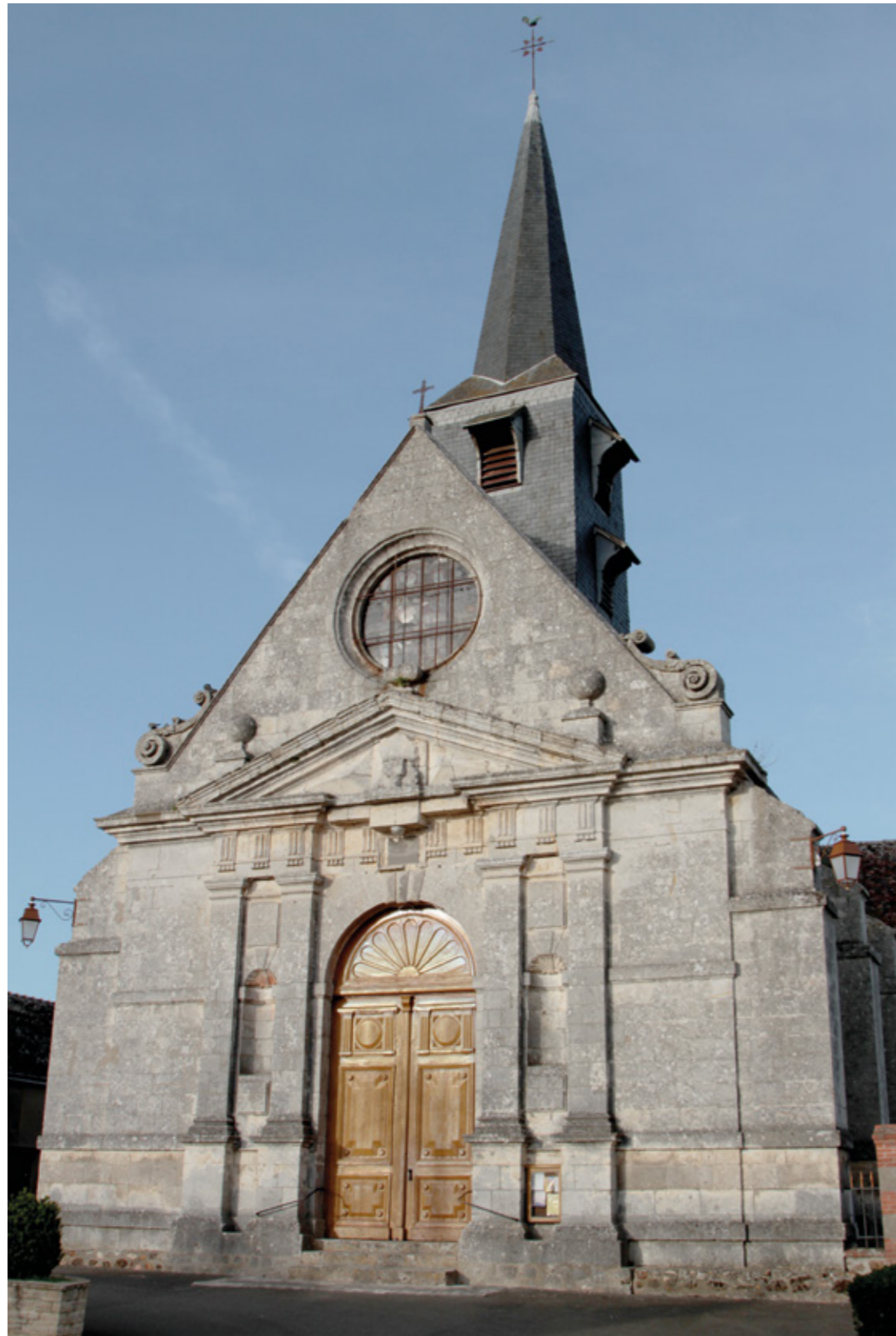
1. Façade ouest

Canton Le Perche, arrondissement Vendôme, 986 habitants