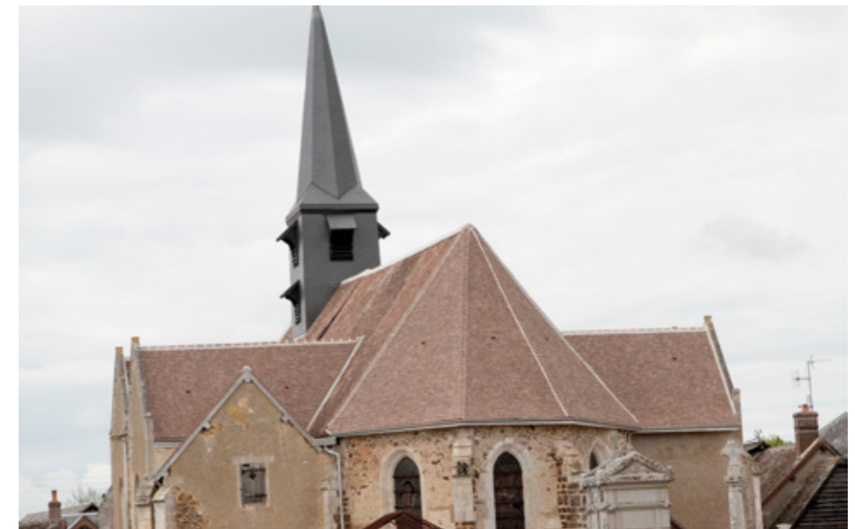
4. Façade est

de saint Michel, qui semble appartenir à l'édifice primitif.