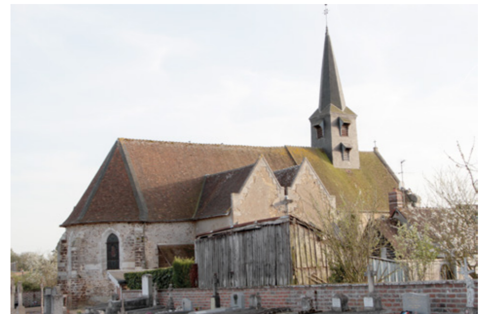
3. Façade sud

Toujours bordé de son cimetière, l'édifice s'élève sur un terrain plat dans la partie nord du bourg, au bord de la route menant au Gault-du-Perche. Il est construit en moellon local, avec une assise de réglage à mi-hauteur et des encadrements de baies en tuffeau. La nef est couverte d'une charpente, de même que le carré du chœur, suivi d'une abside à trois pans voûtée d'ogives, assez fortement remaniée au xix e siècle. À droite et à gauche du chœur s'ouvrent les deux chapelles du xix e siècle couvertes chacune de deux travées d'ogives. On accède à la chapelle sud par une porte en remploi, à arc en accolade mouluré surmonté d'une statuette