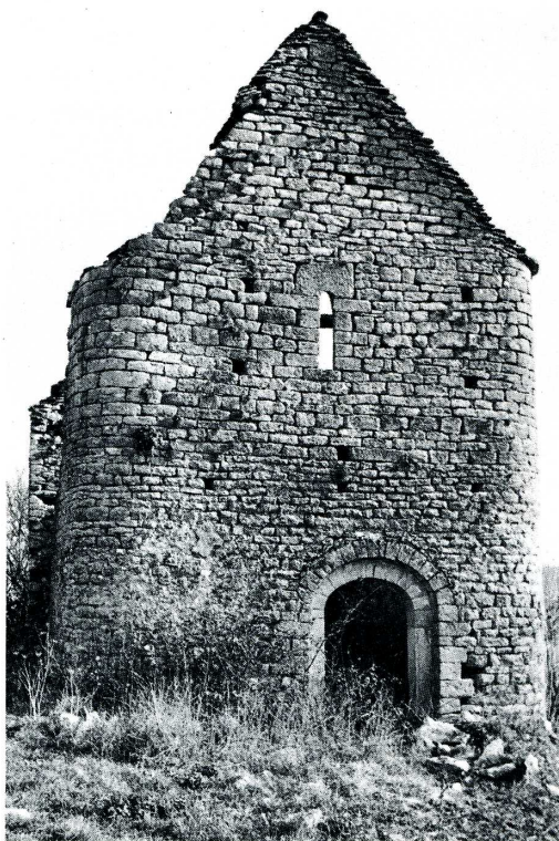
Espédaillac (Lot). Ancienne église de Ginouillac.

elle aurait été impuissante à réaliser un sauvetage que les archéologues considèrent comme essentiel, ainsi que l'a montré M. Marcel Durliat. L'ancienne église de Ginouillac a été construite au début du XI e s., sans pierre de taille avec des murs de petit appareil d'apparence très fruste