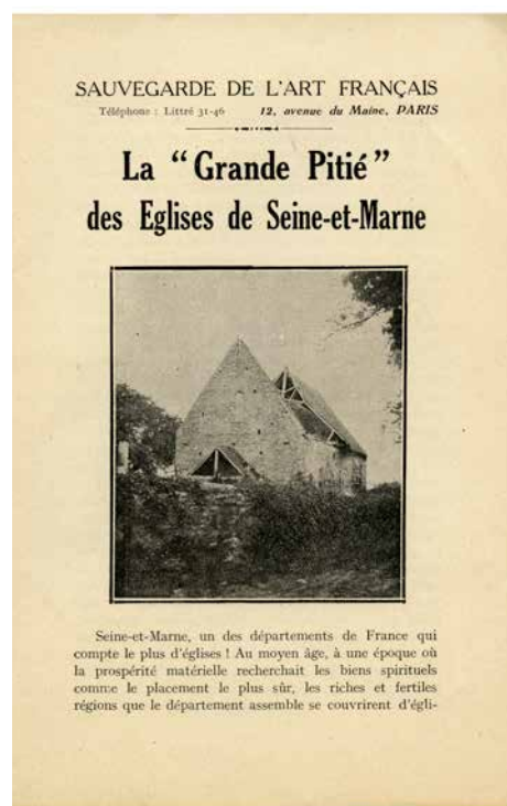
Tract pour la "Grande Pitié" des églises en Seine-et-Marne

Église Saint-Saturnin | Chauconin-Neufmontiers (Seine-et-Marne)