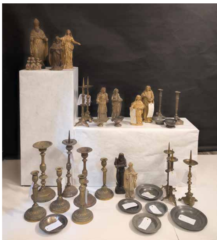
Ensemble d'objets religieux volés dans les églises de Seine-et-Marne, de l'Aube, de la Marne et de l'Aisne