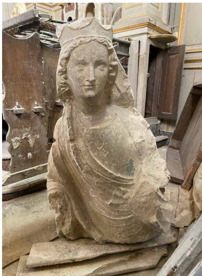
Buste de Vierge à l'enfant

XIV e siècle, calcaire, traces de polychromie