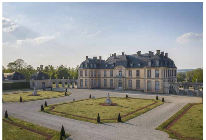
Le château de La Motte-Tilly et sa cour d'honneur