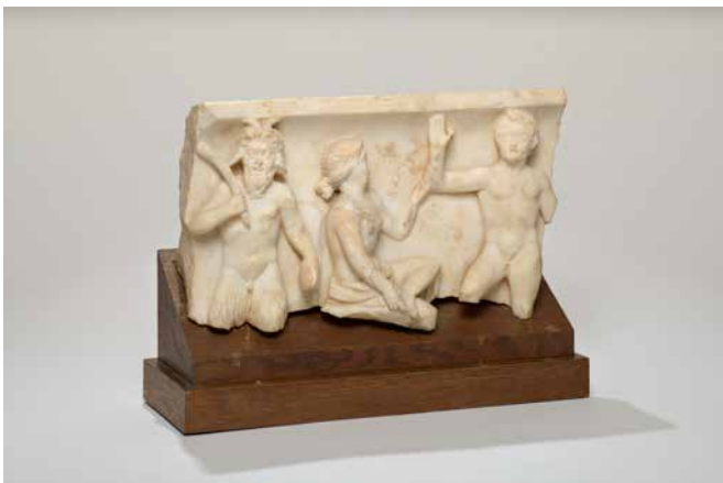
Nympe et Satyres, fragment de sarcophage antique Non daté, marbre blanc Château de la Motte Tilly | Centre des monuments nationaux