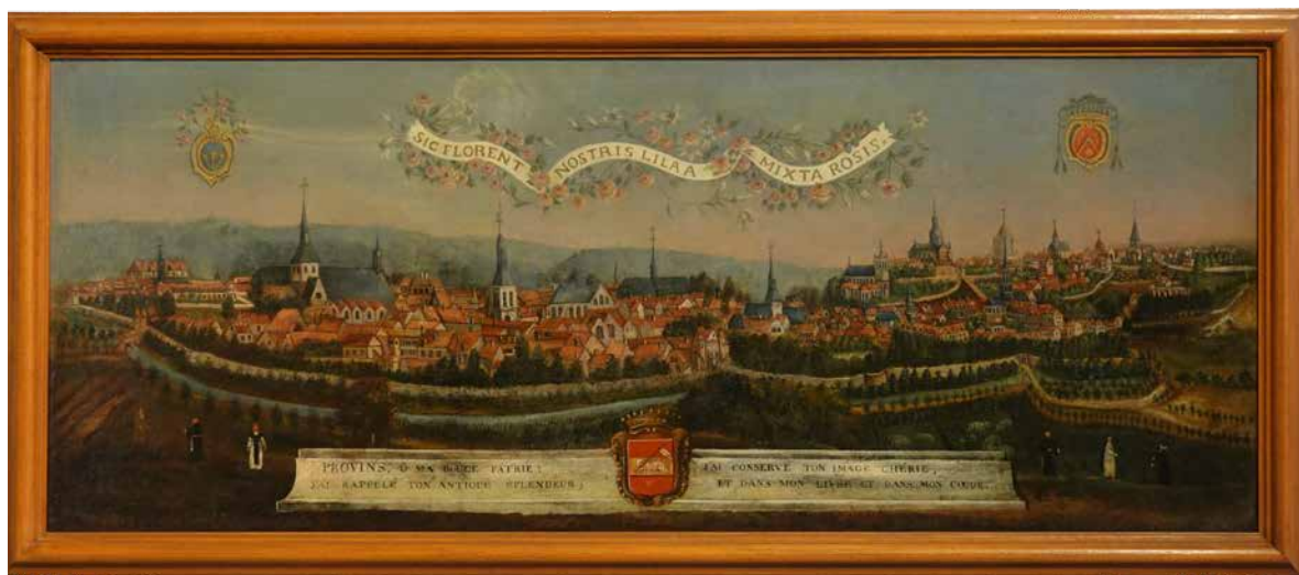
Vue de Provins idéalisée