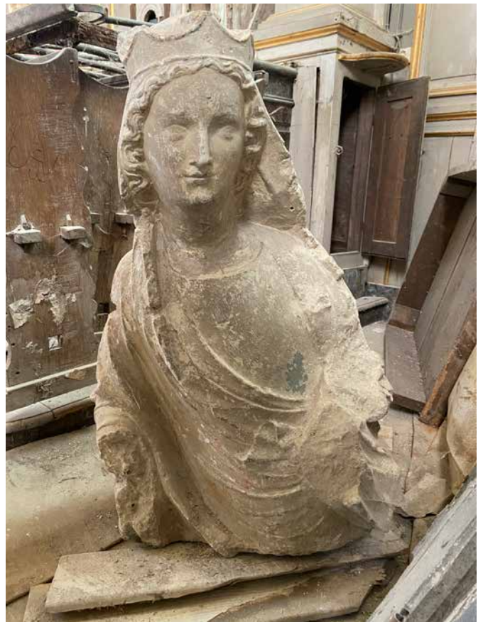
Buste de Vierge à l'enfant, XIV e siècle Église Saint-Saturnin | Chauconin-Neufmontiers (Seine-et-Marne)

Ces deux institutions continuent de faire vivre sa mémoire et poursuivent son action. Tout au long de l'exposition, l'action de la marquise aura été mise en rapport avec ses héritiers d'aujourd'hui. Il s'agira en conclusion également de montrer leur action à travers quelques exemples précis.