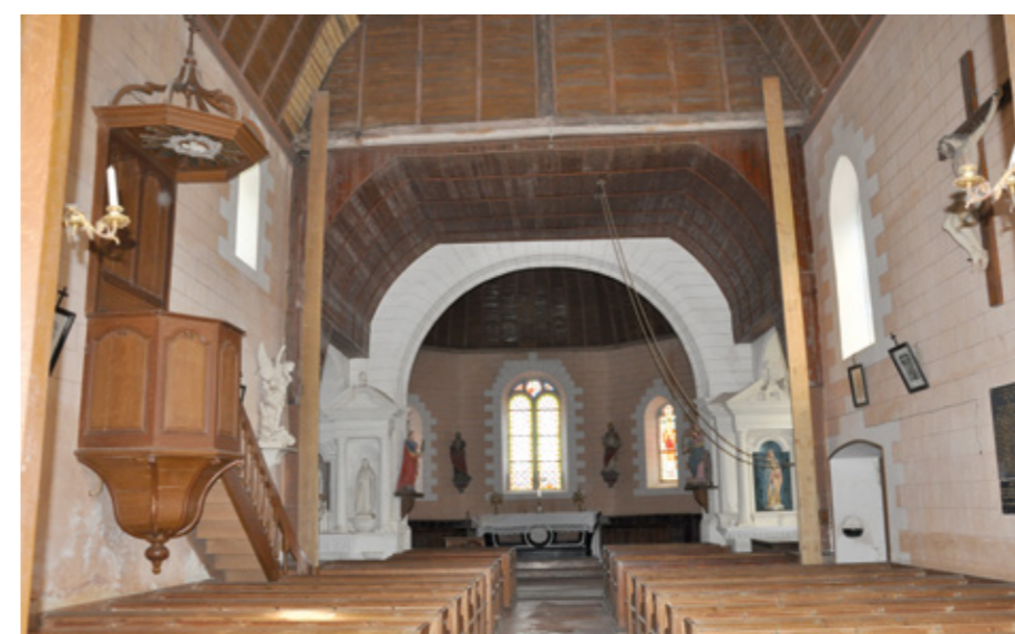
4. Vue intérieure vers le chœur

Des pierres tombales des anciens curés des XV e -XVI e siècles ont été relevées dans l'édifice ; à l'extérieur, une croix avec inscription funéraire du XVI e siècle a été maintenue dans cet ancien cimetière (transféré au XVIII e siècle). Plusieurs statues en terre cuite du XVIII e siècle sont conservées dans l'édifice : saint Grégoire, saint Pierre, sainte Émerentienne. Figurent également parmi les œuvres d'art protégées une Vierge en carton bouilli, du XVI e siècle, et une sainte Barbe du XIX e siècle.