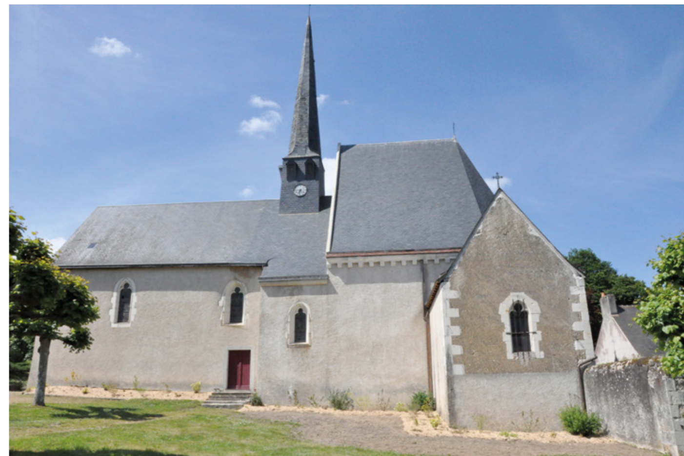
3. Façade sud après restauration

É GLISE SAINT-PIERRE. Le bourg s'élève à l'ouest de Chahaignes, au sud de la forêt de Bercé ; la commune est parcourue par le Dinan, affluent du Loir. Ce fut un site d'habitat gallo-romain. L'église Saint-Pierre est mentionnée dans le cartulaire de l'abbaye Saint-Vincent du Mans ( Floico , 1070), dont dépendait la nomination à la cure. Sans doute est-ce le mur nord, comportant un appareil avec « arêtes de poisson », qui est le plus ancien et qui justifie la première datation de la construction au XI e siècle. De nombreux ajouts et des modifications importantes sont intervenus aux XV e et XIX e siècles : le chœur date des XV e -XVI e siècles. L'édifice est couvert d'un lambris, refait au XIX e siècle.