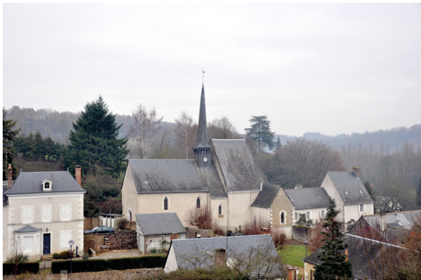
1. Vue générale du site

Canton Château-du-Loir, arrondissement La Flèche, 580 habitants