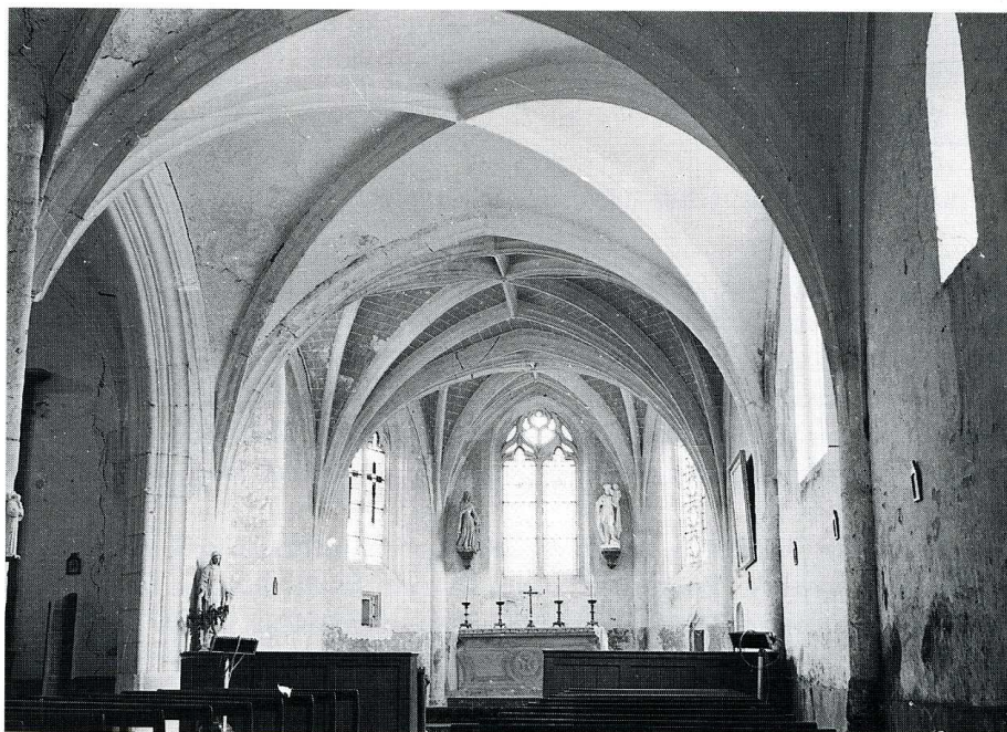
Fontenay-sous-Fouronnes (Yonne). Église Saint- Christophe, chœur et plan.

(Yonne, canton de Coulanges-la-Vineuse, arrond. d'Auxerre, 76 hab.)