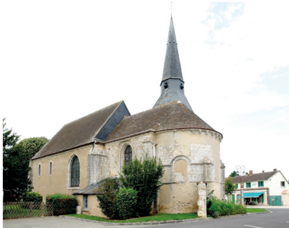
1. Vue sud-est

Canton Lucé, arrondissement Chartres, 864 habitants ISMH 1987 (chœur)