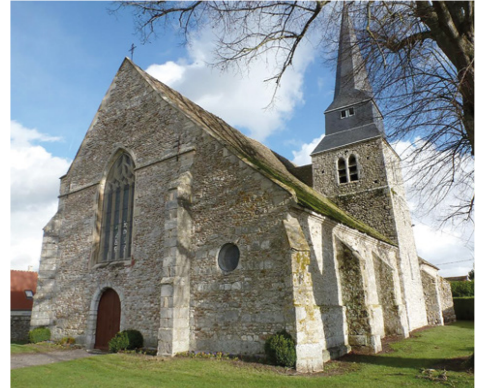
1. Vue sud-ouest

Le chevet à quatre pans est de construction homogène, percé de baies à deux lancettes et un réseau dans un encadrement mouluré en pierre qui suggère une datation vers 1480-1490. Les vitraux historiés du début du XVI e siècle furent en grande partie détruits pendant la période révolutionnaire ; des fragments sont remontés de façon désordonnée au début du XIX e siècle.