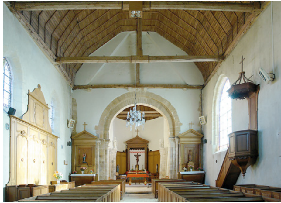
6. Vue intérieure vers le chœur