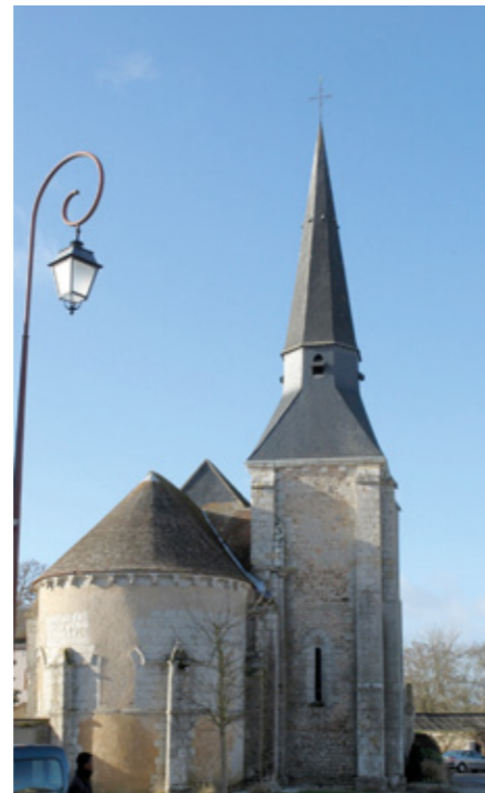
2. Abside et clocher

É GLISE SAINT-SÉVERIN. La commune de Fontenay-sur-Eure est située en bordure de la vallée de l'Eure. L'église, dédiée à saint Séverin, élevée à l'époque romane, se compose d'une nef unique, sans transept, remaniée au xvi e siècle et à laquelle a été adjoint en 1845 un porche. L'église est flanquée, au nord, d'un clocher, construit au xiv e siècle, hors œuvre.