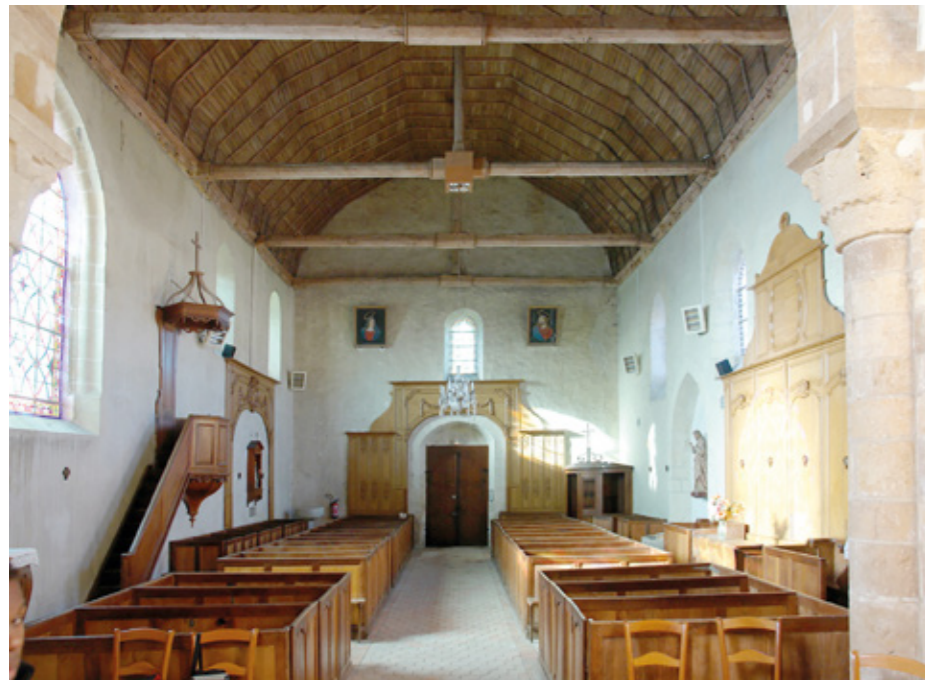
7. Vue intérieure vers l'entrée

formant fermes à voûte lambrissée – parti fréquent après la guerre de Cent Ans – et restaurée entre 1868 et 1869. Un grand arc en plein cintre, dont le doubleau est à double rouleau, retombe sur autant de colonnes engagées, pourvues de chapiteaux à feuillages, et donne accès au chœur. À l'entrée de l'abside, ce dernier présente également les vestiges d'un arc disparu, dont il reste les piliers, les colonnes engagées et les chapiteaux à feuillages. De part