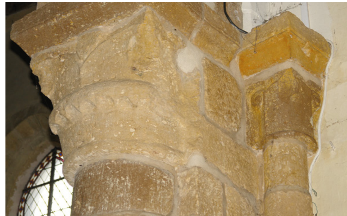
9. Chapiteau de l'arc triomphal

L'intérieur de la nef et le chœur sont couverts par une charpente à chevrons