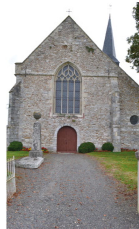
2. Façade ouest