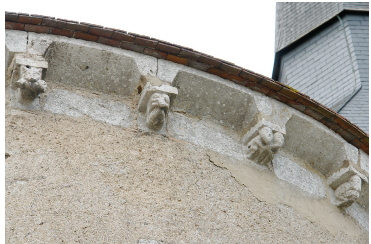
10. Modillons extérieurs de l'abside