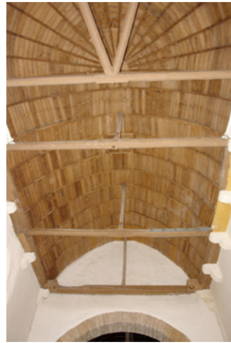
8. Couvrement du chœur

L'église abrite un important ensemble mobilier et une statuaire (Vierge à l'Enfant, Éducation de la Vierge, sainte Barbe, saint Sébastien, IMH) entièrement restaurée. Les boiseries sculptées de la nef du XVIII e siècle proviennent de l'abbaye cistercienne féminine de l'Eau (commune de