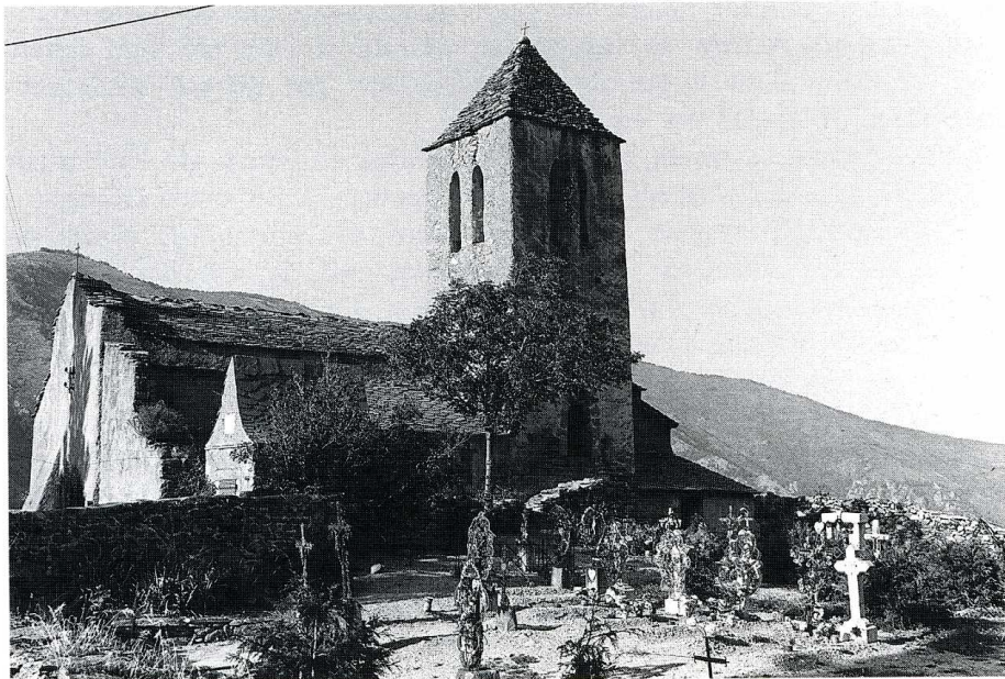
Fontpédrouse (Pyrénées-Orientales). Église de la Trinité à Prats-Balaguer, vue du sud-ouest et plan.

(Pyrénées-Orientales, canton de Mont-Louis, arrond. de Prades, 108 hab.)