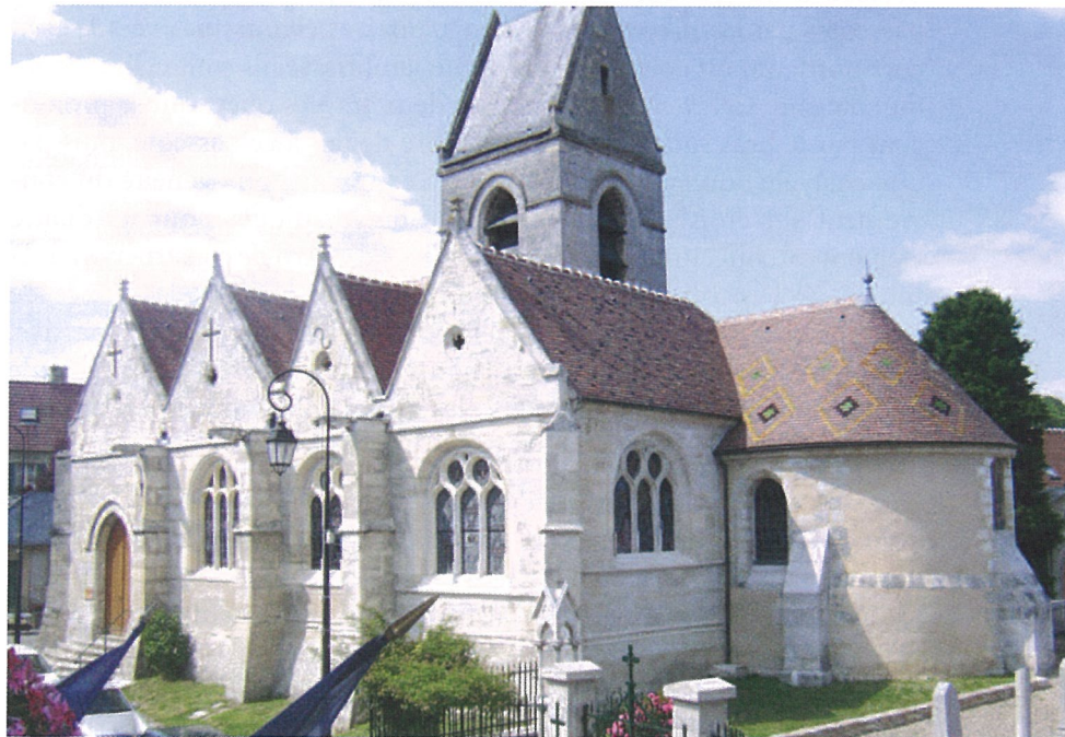
Fourges (Eure) Église Saint-Pierre Vue sud-est après restauration

L'édifice actuel est implanté sur la pente du coteau ouest dominant l'Epte. Son plan cruciforme a été fortement modifié par des ajouts successifs. Le chœur et son abside en petit appareil calcaire à l'assise horizontale régulière datent visiblement du XII e s. et en constituent la partie la plus ancienne. La croisée du transept est surmontée d'un clocher du XIV e s. en pierre de taille, à baies ogivales et toiture en bâtière. On peut attribuer au XIII e s., au vu de maçonneries proches de celle du chœur, le bras nord du transept, très court, ainsi qu'une partie du mur nord de la nef. Le pignon ouest de cette dernière, à rampant,