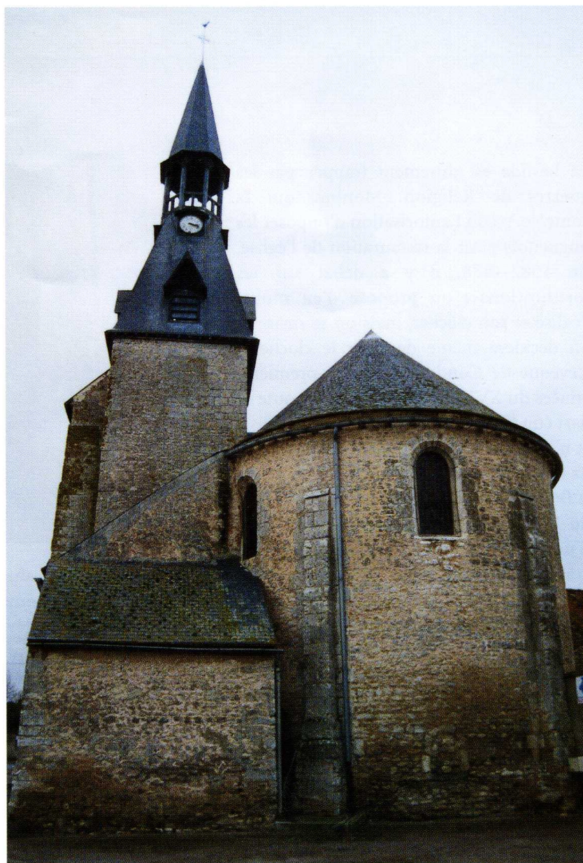
Fresnay-l'Évêque (Eure-et-Loir) Église Saint-Jean-Baptiste 1. Chevet