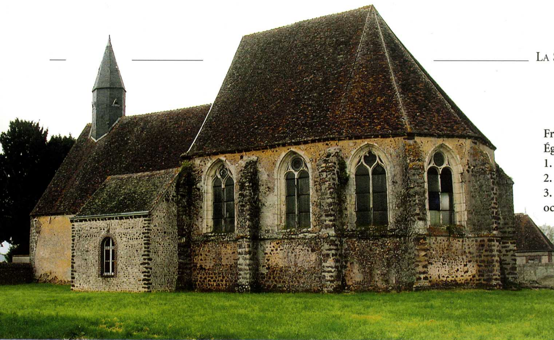
Friaize (Eure-et-Loir) Église Saint-Maurice 1. Façade sud 2. Fenêtre du chœur avant travaux 3. Façade nord et façade occidentale