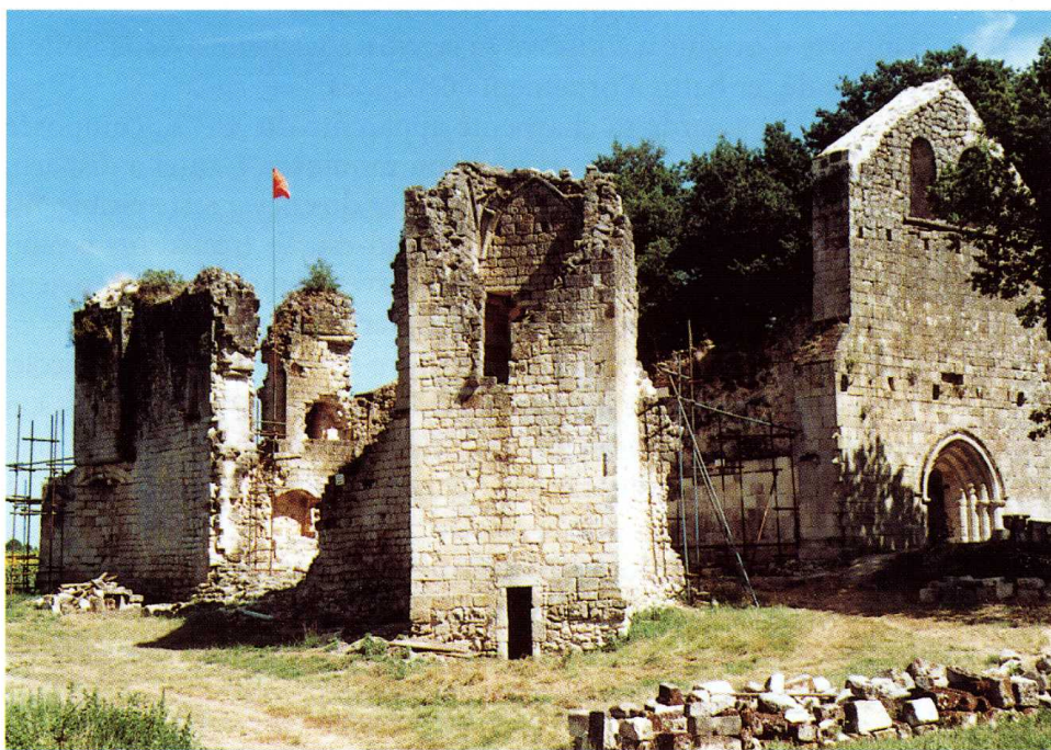
Frontenac (Gironde) Commanderie hospitalière de Sallebruneau 1. Vue aérienne de Sallebruneau 2. Planche de l'ouvrage de Henri de Marquessac (1866) 3. Face nord-ouest de la commanderie