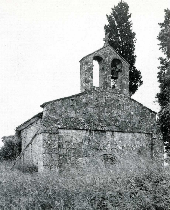
Frontenac (Gironde). Église Sainte-Présentine.