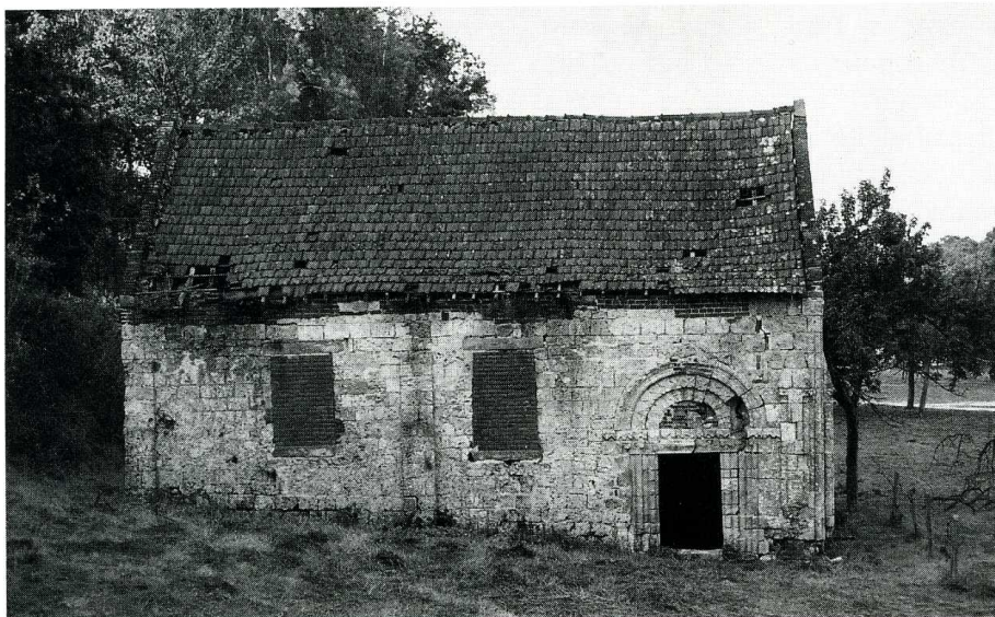
La Gaillarde (Seine-Maritime). Chapelle Sainte-Marguerite, façade nord avant restauration.

Seine-Maritime, canton de Fontaine-le-Dun, arrond. de Dieppe, 420 hab.