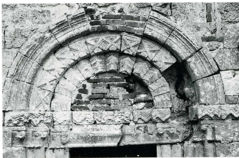
La Gaillarde (Seine-Maritime). Chapelle Sainte-Marguerite, contreforts de l'angle nord- ouest, linteau et voussure de la porte nord avant restauration.

La chapelle Sainte-Marguerite fut construite au XI e s., à une date inconnue, et ne devint, semble-t-il, propriété de l'abbaye de Fécamp qu'en 1223. La tradition fait de cet édifice rectangulaire, de petites dimensions (10,80 m sur 6,60 m), la chapelle d'un fief ou d'une léproserie. Elle est remarquable à plusieurs titres, outre son ancienneté. Son portail en plein cintre est situé, de manière peu com-