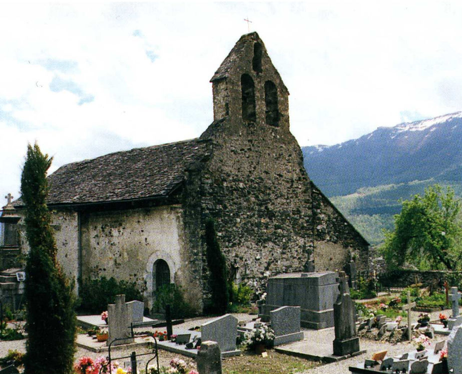
Galey (Ariège) Chapelle Saint-Quentin 1. Vue du nord-ouest 2. Retable du chœur