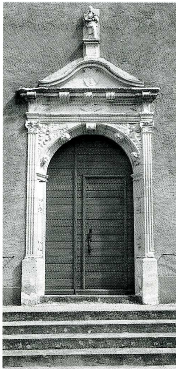
Germigny-sur-Loire (Nièvre). Église Saint-Germain, façade sud et portail ouest.

L' église paroissiale Saint-Germain de Germigny-sur-Loire dépendait jadis de Saint-Germain d'Auxerre, ce qui explique son vocable. Une pierre du porche d'entrée porte la date de 1540 que l'on peut supposer être celle de la construction de l'église. Cette église est de plan rectangulaire, composé d'une nef unique, sans transept, ni abside. L'ensemble était couvert d'une voûte en berceau lambrissé dont subsistent les poinçons et tirants, mais que l'on a fâcheusement plâtrée au XIX e s. Au centre, un massif de quatre arcs contrebuté par des arcs brisés retombant sur les murs gouttereaux soutient le clocher qui se trouve au-dessus. Ce massif doit être récent, probablement du siècle dernier. L'extérieur est lui aussi très simple, sans contrefort. La porte occidentale est un témoin du goût renaissant de cette époque : un fronton sur corniche et entablement repose sur deux pilastres cannelés à chapiteau corinthien figuré. Le clocher possède une cloche qui porte la date de 1661. Pour la remise en état de la couverture et pour la réfection de l'intérieur de l'église, la Sauvegarde de l'Art Français a accordé en 1992 une aide de 60 000 F.