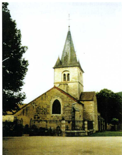
Gisse-sur-Ouche (Côte-d'Or) Église de la Nativité de la Vierge 1. Chevet de l'église 2. Façade sud après travaux