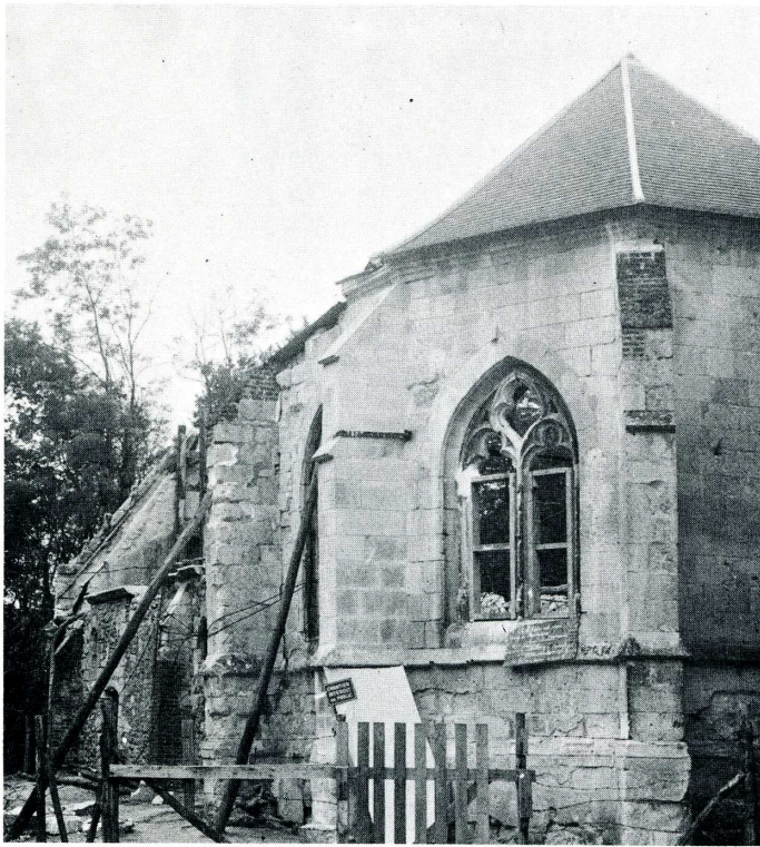
Grandfresnoy (Oise). Chapelle Sainte-Catherine.