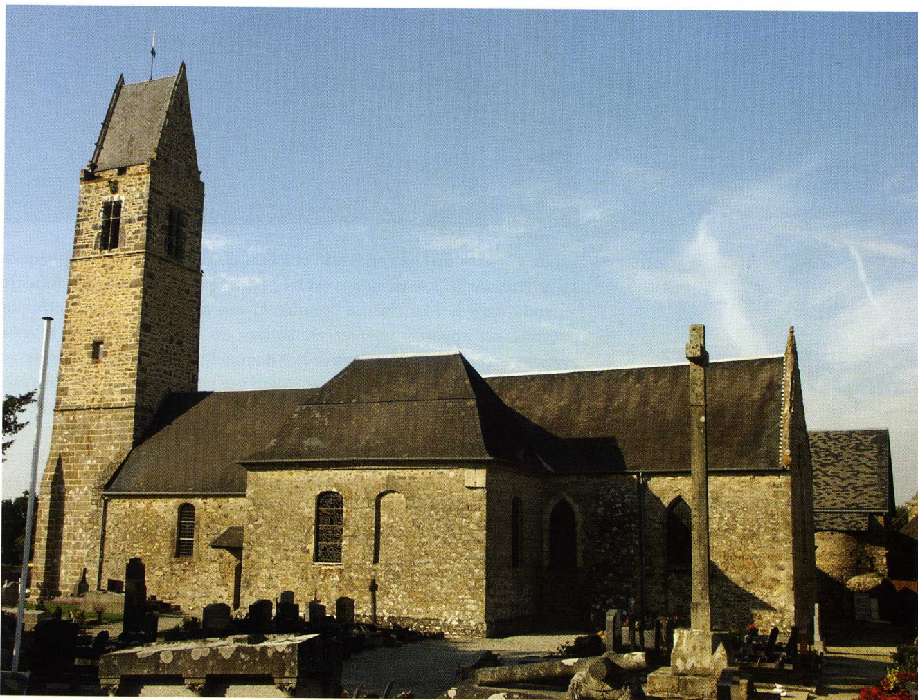
Gratot (Manche) – Église Saint-Gerbold Façade sud