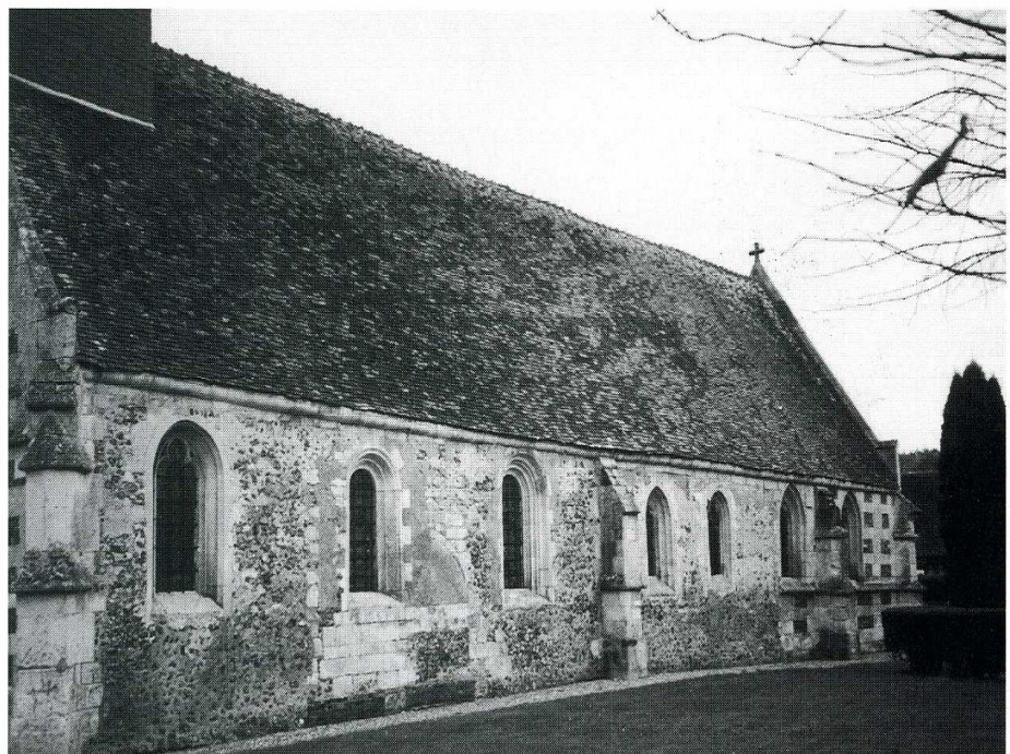
Grosley-sur-Risle (Eure). Eglise Saint-Léger. 3. Mur latéral sud. 4. Vue générale de l'intérieur de l'église.

A l'intérieur, une même voûte en carène renversée couvre toute la longueur de l'édifice. La séparation entre les trois travées de la nef et les deux du chœur est seulement marquée par la présence de deux autels latéraux, dédiés l'un à saint Léger et l'autre à la Vierge, et par l'adjonction d'un Calvaire portant la date de 1656 sur l'entrait servant de poutre de gloire.