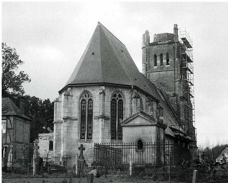
Hattenville (Seine-Maritime). Église Saint-Pierre, chevet et clocher en cours de travaux.

Seine-Maritime, canton de Fauville-en-Caux, arrond. du Havre, 469 hab.