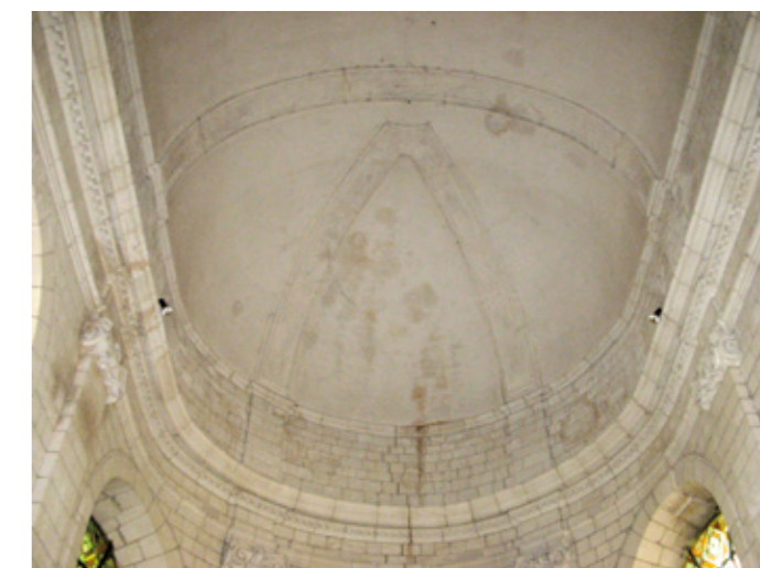
3. Voûte du chœur