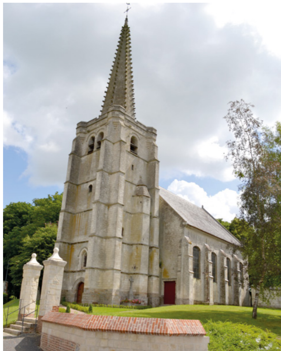
1. Vue générale de la façade sud-ouest

Canton Avesnes-le-Comte, arrondissement Arras, 563 habitants ISMH 1926