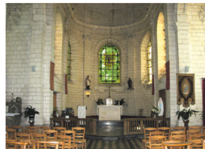
6. Vue intérieure vers le chœur