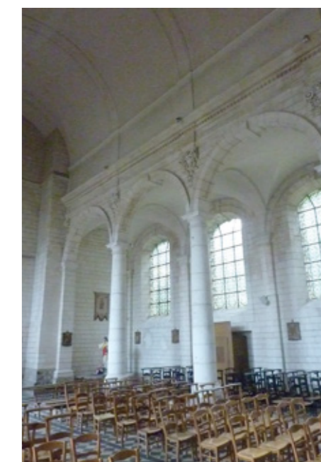
5. Bas-côté nord