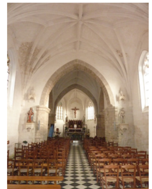
4. Vue de l'intérieur vers le chœur

P. Héliot, Les Églises du Moyen Âge dans le Pas-de-Calais , Arras, 1951, p. 459.