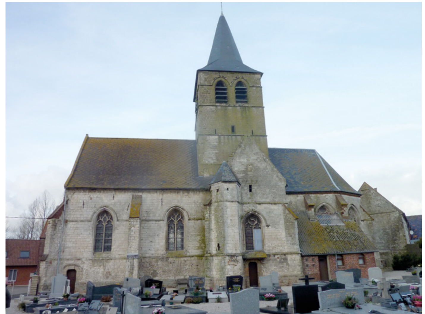
2. Façade sud