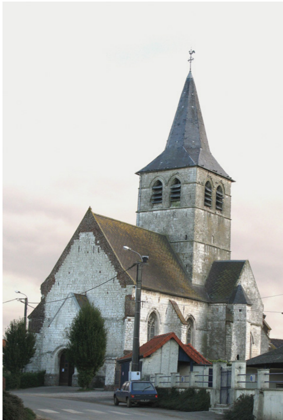
1. Vue de la façade sud-ouest