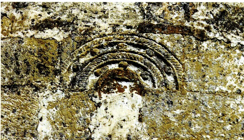
Heugas (Landes) Église Notre-Dame 3. Abside ; linteau monolithe orné (cl. Cl. Desqueyroux, arch.)

Arch. Sauvegarde de l'Art français : Cl. Desqueyroux, Projet de réhabilitation de l'église paroissiale , novembre 1999, ms, 9 p.