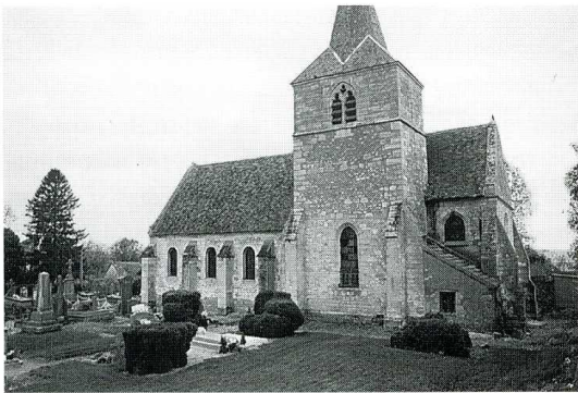
Hodenc-l'Évêque (Oise), église Saint-Pierre. 1. Vue du nord-est. 2. 3. Façade sud.