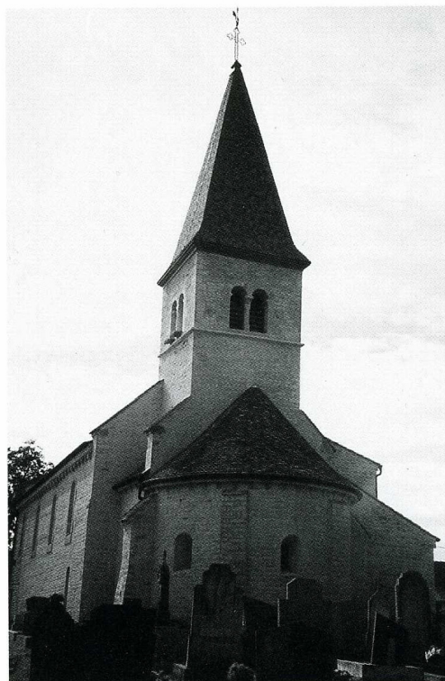
Huilly-sur-Seille (Saône-et-Loire), église Saint-Georges, vue de l'abside après travaux.

Entourée de son cimetière, sur un coteau dominant la Seille, l'église de Huilly est attestée dès 981, date à laquelle elle est donnée à l'abbaye de Tournus. Elle était alors dédiée à saint Jean et non, comme aujourd'hui, à saint Georges. Les parties les plus anciennes de l'édifice actuel remontent au XII e s. Il s'agit essentielle-