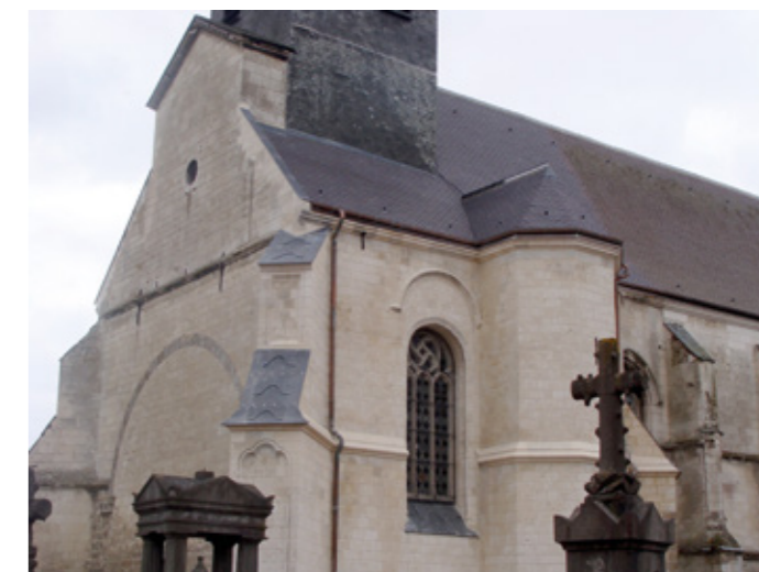
3. Chevet après restauration