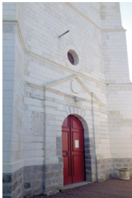
2. Détail de la tour-clocher de la façade occidentale après restauration