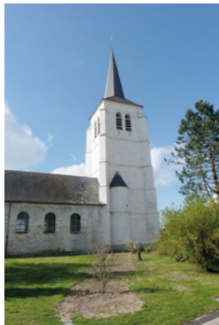
1. Vue de la tour-clocher après restauration

Canton Avesnes-le-Comte, arrondissement Arras, 225 habitants