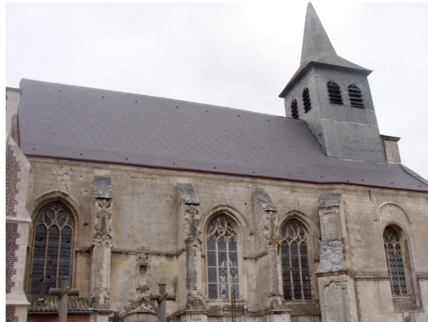
1. Élévation sud

Canton Lillers, arrondissement Béthune, 1 472 habitants