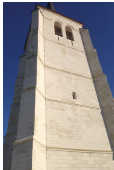
3. Tour-clocher après restauration

Située près de Pas-en-Artois, dans l'Artois, l'ÉGLISE SAINT-BARTHÉLEMY fut vraisemblablement reconstruite en 1726, une fois la paix définitivement installée dans la région. Contrairement à la plupart de ses voisines, dont subsistait tout ou partie de la tour-clocher, les travaux ont porté ici sur la totalité de l'édifice. Saisie à la Révolution et mise en adjudication, elle dut être démolie par l'un de ses acquéreurs, à l'exception de la tour, jugée trop élevée pour en envisager la démolition.