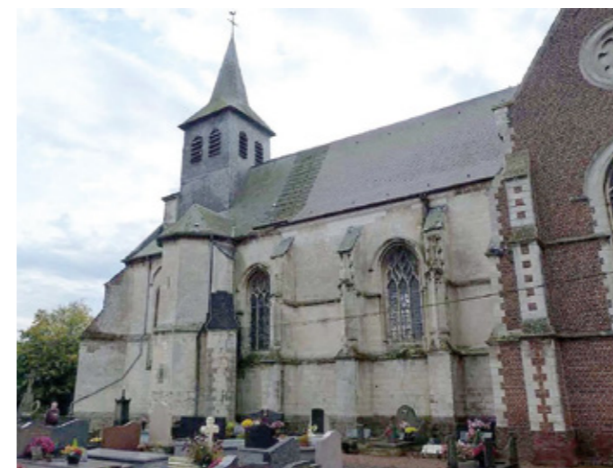
2. Élévation nord