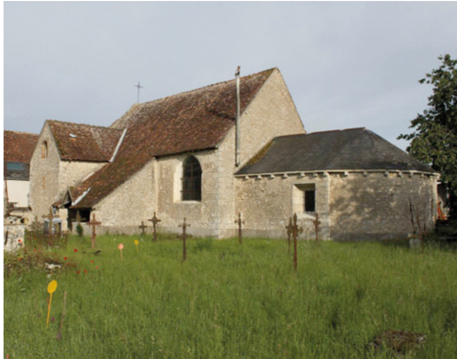
1. Façade sud-est

Le petit édifice, qui s'élève dans la partie nord du hameau, sur terrain plat, est encore accosté de son ancien cimetière. Il est bâti en moellons locaux avec des chaînes en pierre de taille. À l'extérieur, les murs, qui ne sont pas épaulés de