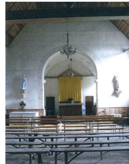
3. Vue de la nef et du chœur