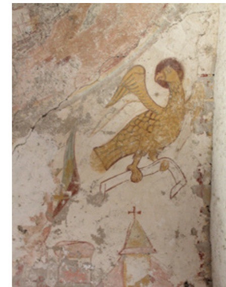
4. Décor mural du XIII e siècle