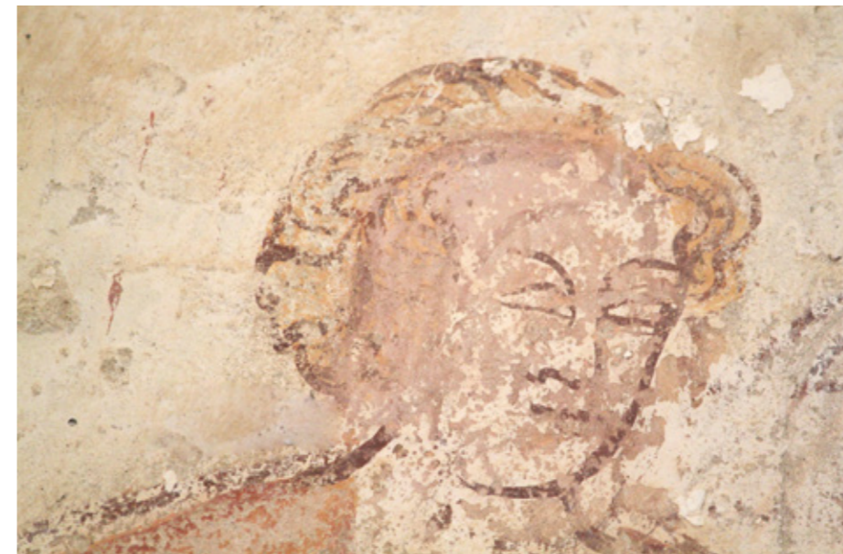
6. Décor mural du XIII e siècle

Drac Centre, Centre régional des monuments historiques : F. Audebrand, Thématique sur les peintures murales (Commission régionale des monuments historiques du 26 juin 2007) [ms], p. 4-6.