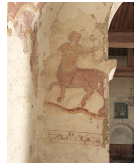
5. Décor mural du XIII e siècle

contreforts, sont sommés d'une corniche sobre à modillons cubiques. De plan très simple, la chapelle se compose d'une nef charpentée, suivie d'un chœur plus étroit voûté en berceau légèrement brisé, et d'une abside couverte en cul-de-four. Un clocher, ajouté à une date indéterminée au sud-ouest de la nef, a été en partie arasé, et le portail en plein cintre percé dans le mur pignon occidental a été muré. On accède aujourd'hui au sud par un portail plus petit, abrité sous un porche, donnant sur le cimetière.