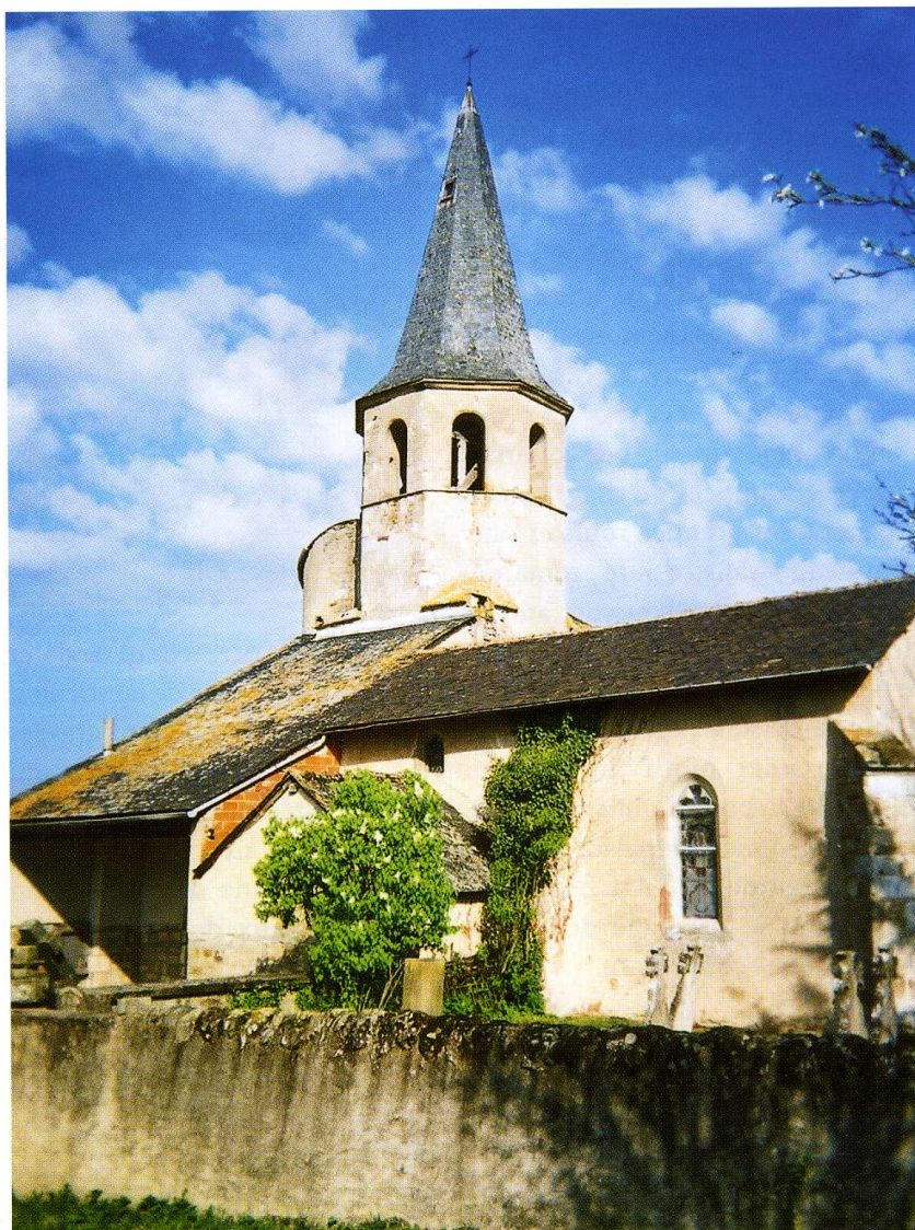
Lacapelle-Ségalar (Tarn) Église Sainte-Cécile 1. Vue du sud-est