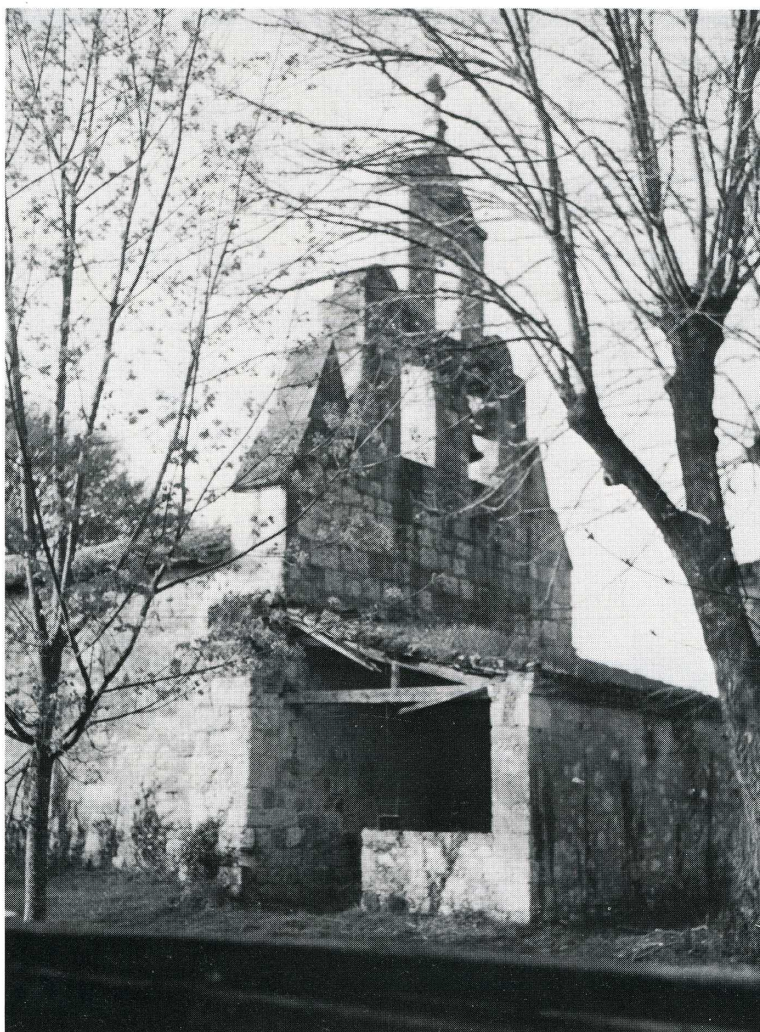
Lamontjoie (Lot-et-Garonne). Église Sainte-Quiterie-de-Daubèze.