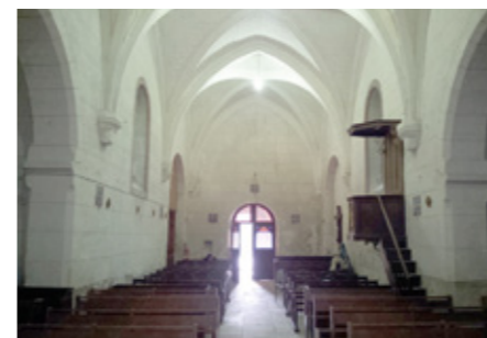
3. Vue intérieure vers l'entrée

En 1849, l'église étant jugée trop petite pour le nombre des fidèles, fut envisagée la construction de deux chapelles latérales ; seule la chapelle sud fut construite dans la partie basse de la nef. En face, au nord, le mur de la première travée de la nef porte la trace de l'ouverture prévue pour accéder à la future chapelle. En 1854, la restauration complète de l'intérieur de l'église ainsi que