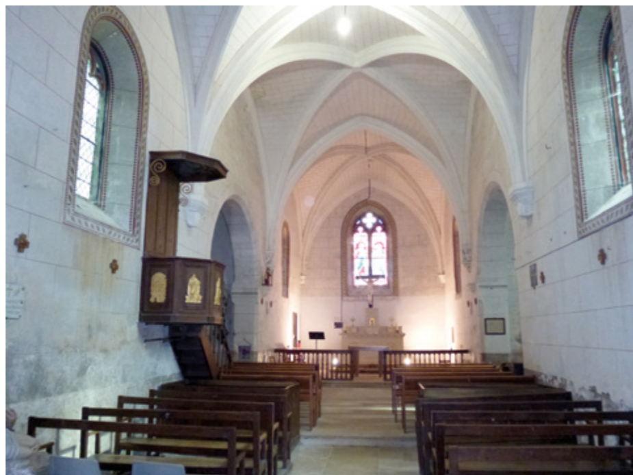
2. Vue intérieure vers le chœur

À la fin du XV e ou au début du XVI e siècle, l'église fut transformée et agrandie. Les arcs latéraux de la base du clocher furent fermés et les contreforts de la tour renforcés. La nef a été rehaussée pour recevoir une nouvelle charpente. Le chœur et le chevet furent entièrement reconstruits. Deux chapelles latérales, élevées alors, communiquent avec la troisième travée de la nef. La chapelle nord, dédiée à saint Roch, fut construite pour le sieur du Solier et la chapelle Saint-Jean, au sud, pour le seigneur de Coulogne (terre, seigneurie, « véhérie » et vicomté de Coulogne), deux terres situées dans la paroisse du Subdray.