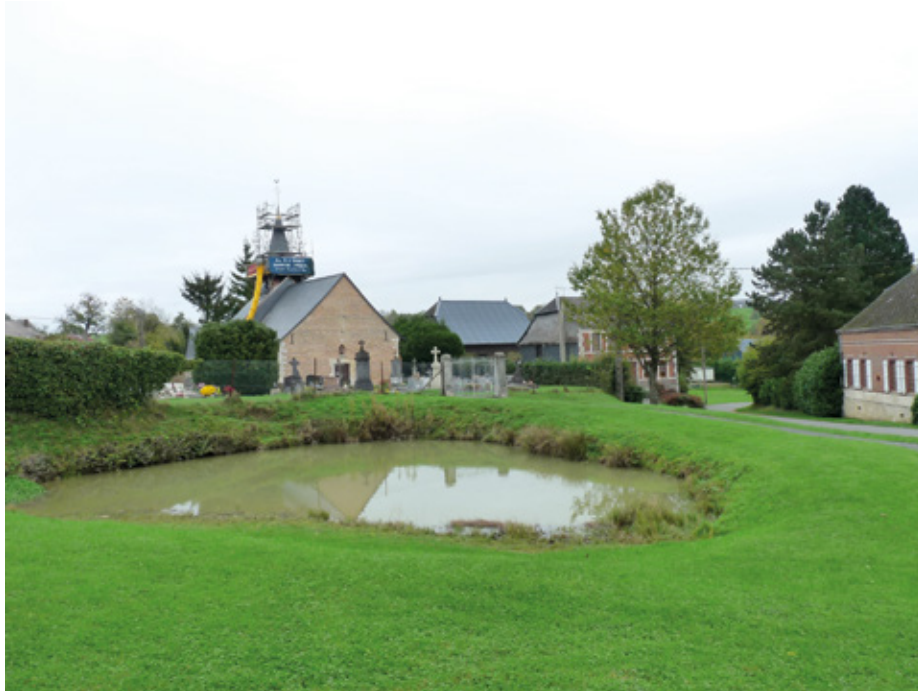
1. Vue du site depuis l'ouest