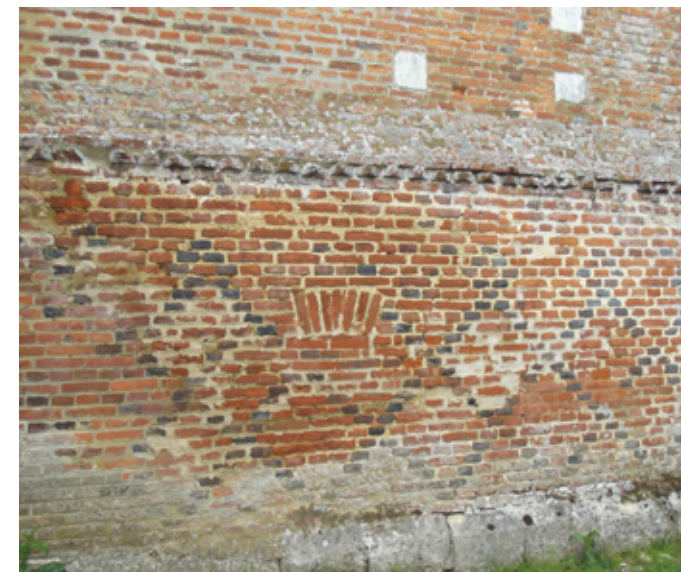
6. Détails de l'appareil de brique