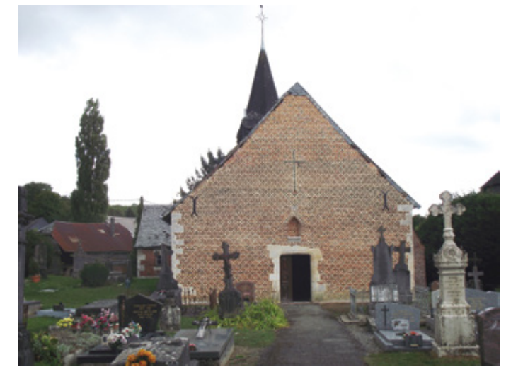
4. Façade ouest après travaux