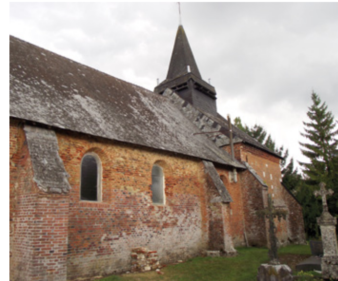
5. Façade sud avant travaux