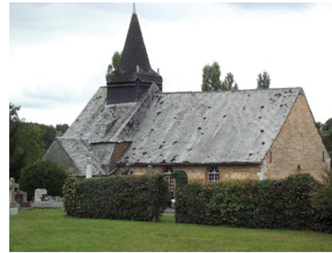
3. Vue nord-ouest avant travaux